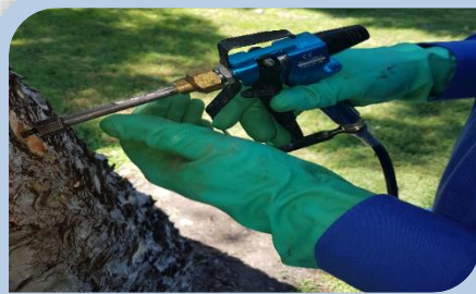
Tratamiento de ENDOTERAPIA VEGETAL.