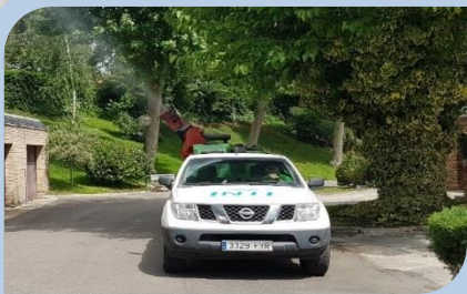
Vehículo de fumigación con cañón nebulizador