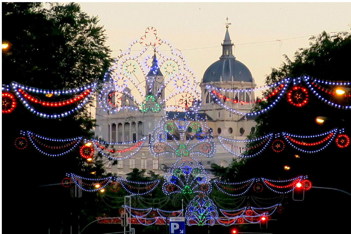
Fig. 17. Verbenas de San Antonio. Fotografía Antonio Agromayor Arredondo. Madrid. 2022

la viabilidad en el tiempo del patrimonio inmaterial y fomentando su impacto económico, social, ambiental y cultural. Y, en este sentido, resulta clave que las estrategias de salvaguarda, al incorporar la sostenibilidad en sus planteamientos, también promuevan la reflexión en la materia tanto a las comunidades portadoras como a la ciudadanía en general y a los distintos agentes implicados. Pongamos el ejemplo del turismo. Su incidencia sobre el patrimonio es indudable, y consideramos que un turismo es sostenible cuando genera beneficios económicos y sociales sin poner en riesgo los valores patrimoniales de las manifestaciones culturales. Pero para que esta influencia resulte beneficiosa es necesario establecer canales de diálogo entre los diversos colectivos y agentes sociales implicados. En este proceso es primordial la comprensión por parte de las comunidades de la relación entre el patrimonio y el turismo, de manera que puedan decidir la forma en que presentan sus manifestaciones culturales frente a la población foránea. Precisamente, se han incluido en esta obra sendos artículos dedicados a los criterios que seguir a la hora de desarrollar proyectos para la salvaguardia del PCI madrileño y a la relación entre turismo y sostenibilidad, analizando los riesgos y oportunidades para el patrimonio de la Comunidad de Madrid. (Fig. 17).