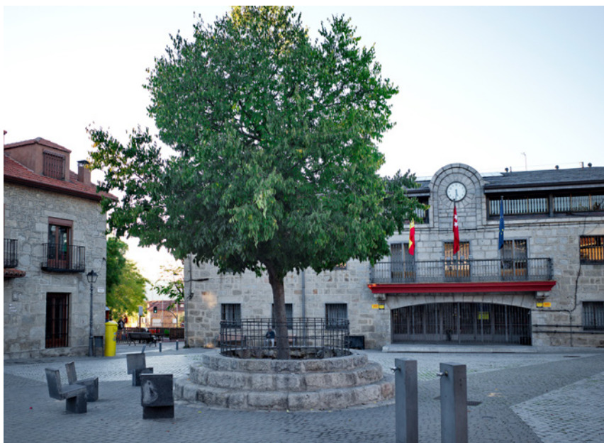
Fig. 1. Árbol de Colmenarejo.