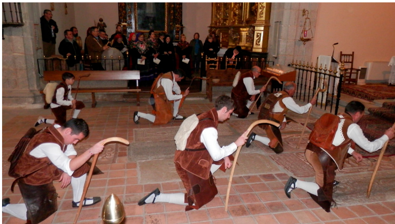
Fig. 2. Objetivo Tradición. La Pastorela de Braojos de la Sierra. 2016

se generan en los diferentes contextos, y que tienen como objetivo principal la realización y dinamización de muchas de estas expresiones, son la herramienta fundamental para aplicar las medidas de salvaguarda que permitan mantener el legado tradicional y, con él, la sostenibilidad de los pueblos y barrios, desde el plano cultural, social e incluso económico.