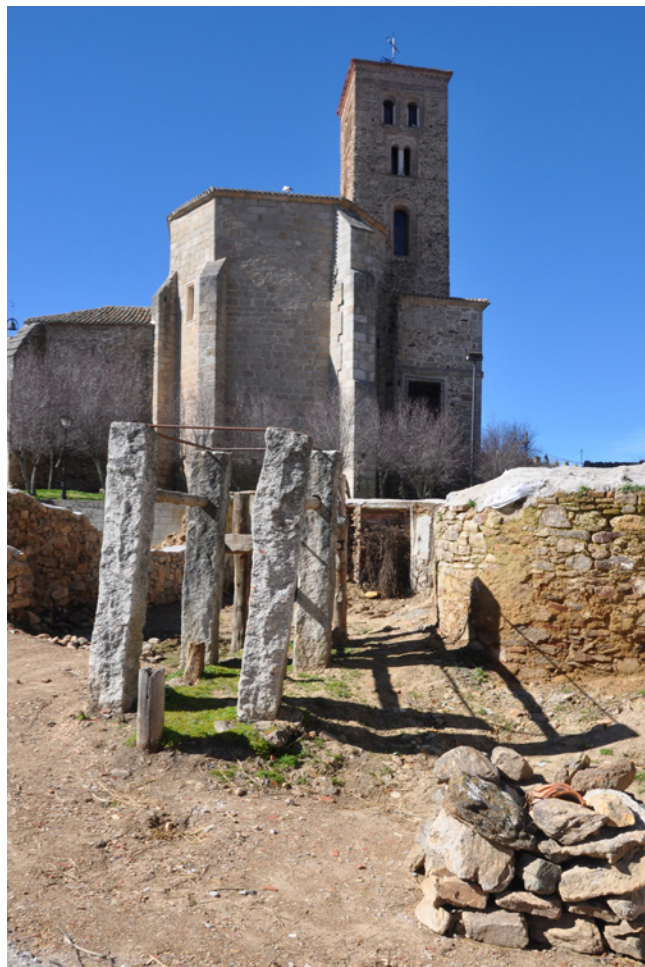
Fig. 5. Potro de herrar. Buitrago de Lozoya. 2018