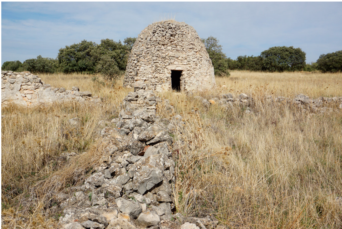
Fig. 2. Chozo del Castaño, construido en piedra seca con bóveda falsa, y vestigios de corrales en primer término. Villar del Olmo. 2022

tipología es variada, suelen responder a una construcción de pequeño tamaño, de planta circular o rectangular, con doble muro de piedra en seco, cubiertos por estructuras planas (inclinadas u horizontales) de vigas de madera y cubierta de piedra o vegetal, o bien por estructuras cupuliformes que crean falsas bóvedas mediante la aproximación horizontal de hiladas, cerrando el diámetro según se avanza en altura hasta alcanzar la clave. Estas construcciones comparten sabiduría constructiva con otras actividades: colmenares, neveros, tinados, guardaviñas, almacenes y viviendas, entre un gran abanico de tipologías, han sido erigidas mediante este arte, que caracteriza la arquitectura tradicional 14 de nuestros parajes rurales madrileños gracias a los saberes y prácticas que en ella residen. A pesar de mostrar paralelismos en sus morfologías tipológicas, en cada región, dentro del mismo ámbito autonómico, reflejan especificidades propias de la comunidad que las ha producido, ya sea por las peculiaridades que les otorga la elección de un determinado material (tanto en el cromatismo como en el aparejo o en la escala que adoptan), por la climatología que han de regular (más frío y húmedo en las zonas de montaña, más templado y seco hacia áreas meridionales), por su adaptación a las funciones propias de cada