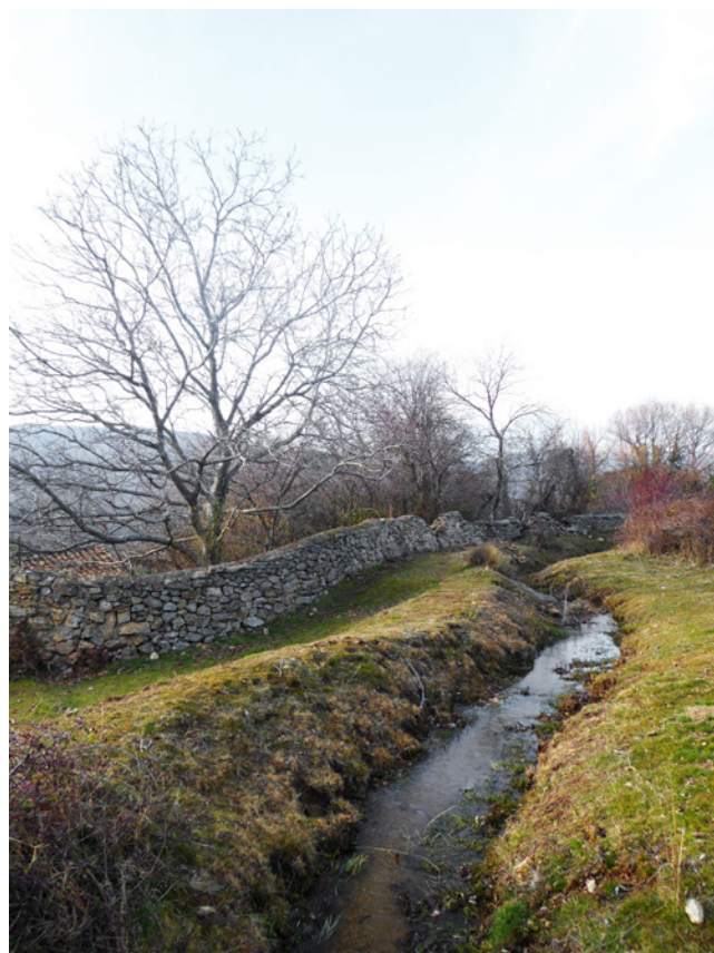
Fig. 10. Reguera de Canencia. Fotografía Elena Agromayor Navarrete. 2019

Los vecinos que podían acceder al agua de la reguera , el tiempo con el que contaban y el mantenimiento de los canales se regulaba a través de las llamadas Comunidades de Regantes, cuya existencia está documentada desde época medieval en algunos municipios, y que acogía a los vecinos con derechos. Estas comunidades contaban con ordenanzas propias y figuras garantes del sistema como el alcalde, el aguador o guarda y el escribano. El alcalde, nombrado el día de limpieza de la reguera al llegar la primavera, era responsable de repartir los tiempos de riego entre los vecinos con derechos. Y precisamente el día de limpieza tenía un fuerte componente simbólico, pues, a modo de ritual de iniciación, en los pueblos de Montejo y Robregordo los trabajadores que iban a limpiar por primera vez, así como los invitados, el