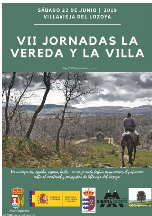
Fig. 2. Imagen de uno de los carteles de las Jornadas. 2019

dio fue organizar un acto para repartirlos. Se barajaron varias opciones, pero se optó por entregarlos a través de una jornada.