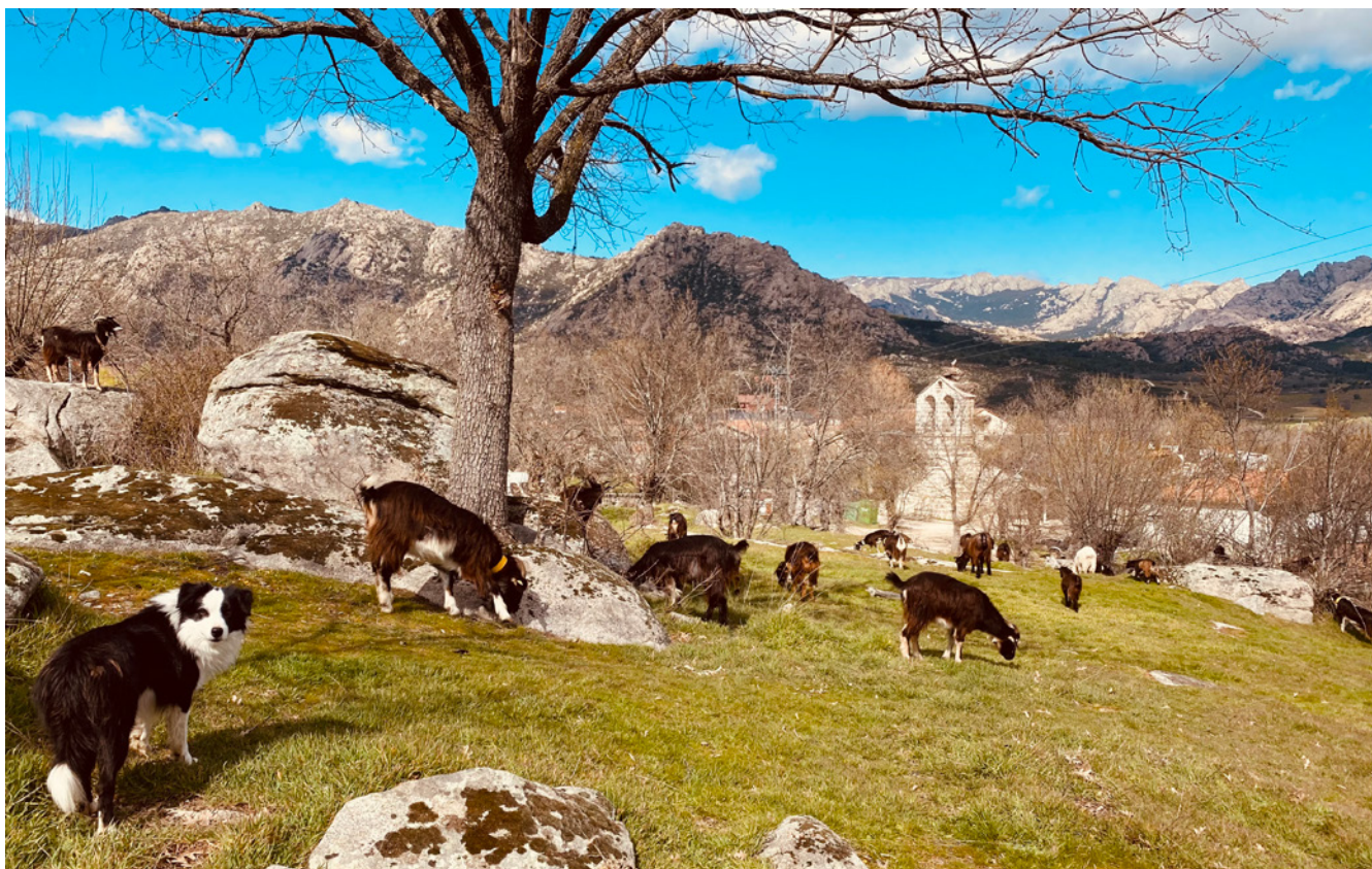
Fig. 1. Rebaño Municipal de cabras guadarrameñas pastando y desbrozando una parcela en El Boalo.