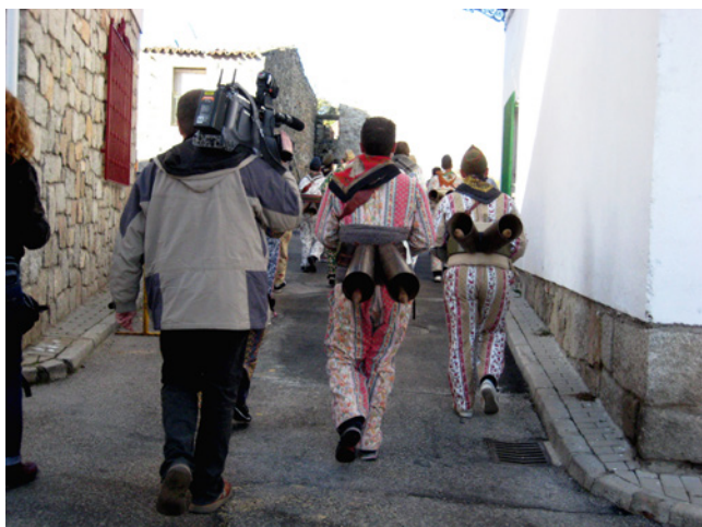
Fig. 3. Los medios de comunicación juegan un importante papel en la difusión del patrimonio inmaterial y, con ello, en su promoción turística. Un adecuado tratamiento de la información es fundamental para su correcta interpretación y salvaguarda. Fresnedillas de la Oliva.

cliente, adecuadas respuestas a la demanda...) y salvaguarda del patrimonio tanto material como inmaterial (en lo que representa para la cohesión social y la identidad de las comunidades receptoras), una cuestión más delicada quizá en el caso de este último por sus características singulares. Un diálogo que tiene que generar oportunidades y aminorar riesgos para las dos partes, garantizando su viabilidad a largo plazo a partir de un reconocimiento mutuo de las peculiaridades y necesidades del otro.