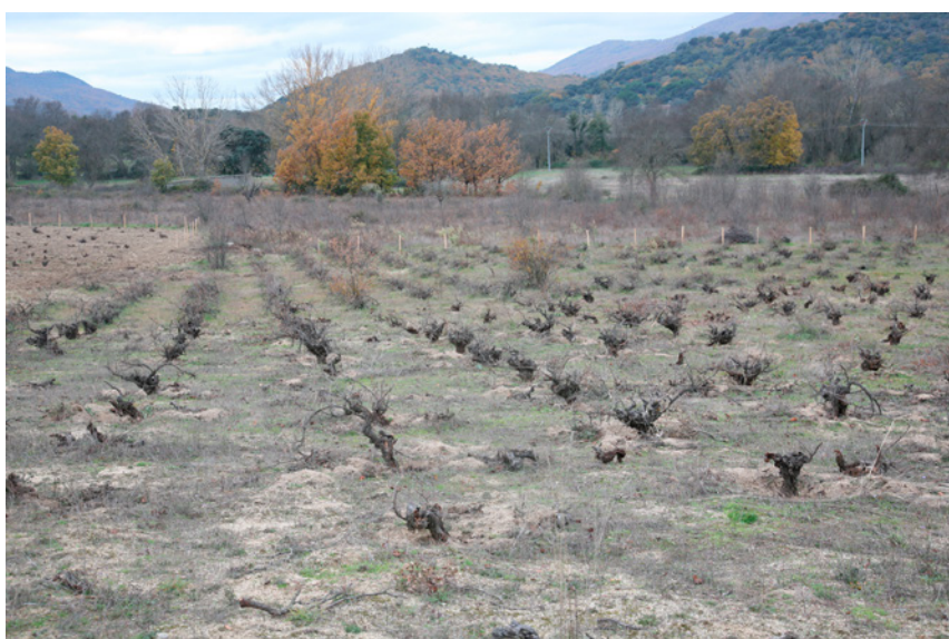
Fig. 2. Viñedo. San Martín de Valdeiglesias. 2021

cultivo con caballares, como podemos ver en La Rioja, El Bierzo o El Priorato.