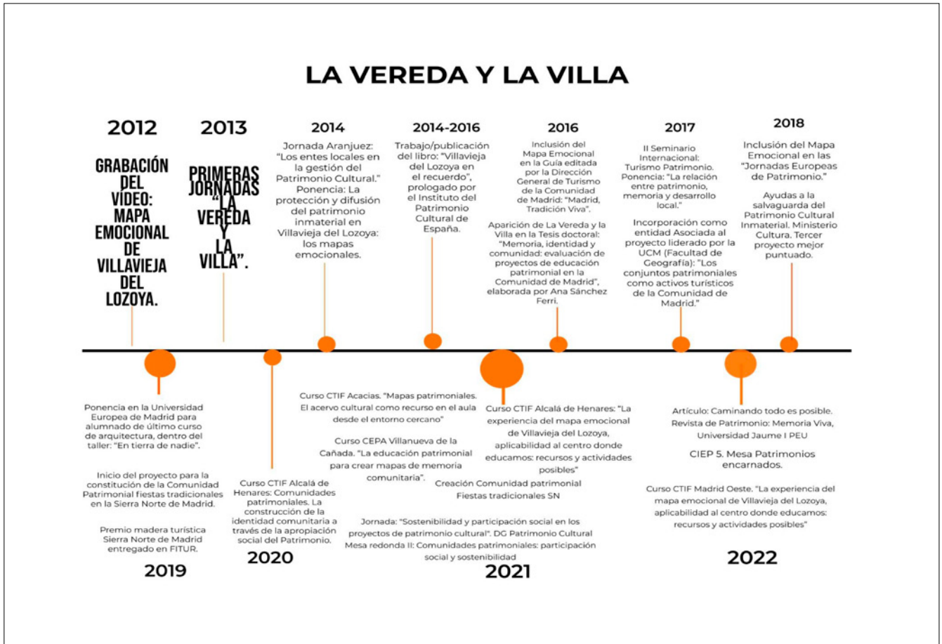
Fig. 6. Línea histórica

nocer una manifestación cultural hay una parte emisora/portadora, un receptor y un espacio de intercambio. Desde las entidades y organizaciones podemos gestionar y facilitar los dos últimos, pero lo imprescindible en nuestro caso ha sido identificar y desarrollar el proyecto junto a las personas portadoras.