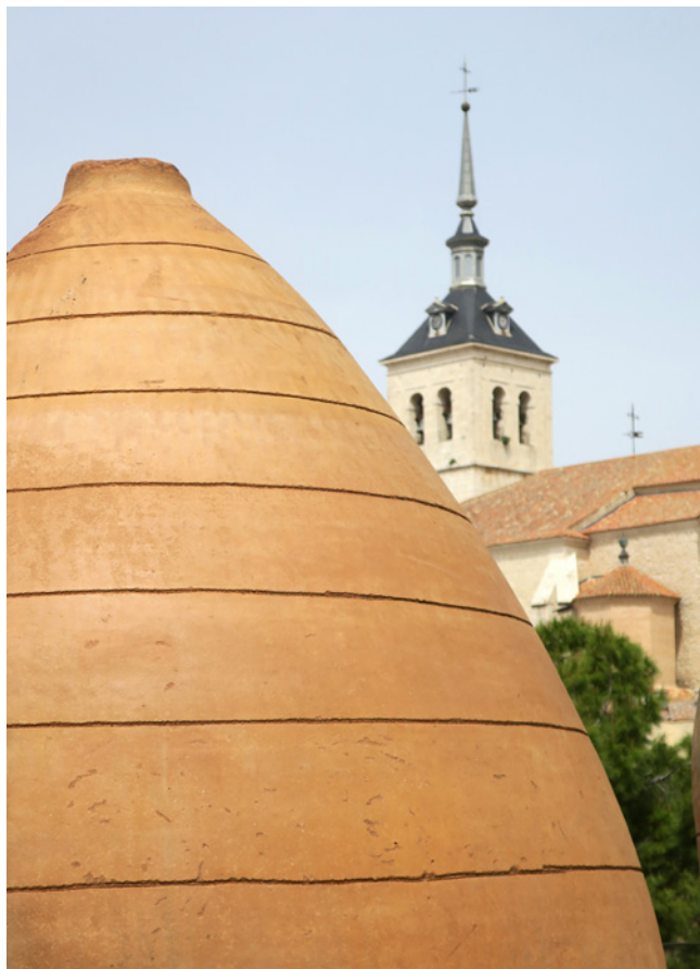
Fig. 2. Cultura del barro. Tinaja en el Museo de cerámica y cantería. Colmenar de Oreja. 2022

social. Sin embargo, uno de los principales problemas del concepto de comunidad y de su implicación en la salvaguardia sostenible del PCI es la dificultad de definir a estos colectivos, naturalmente heterogéneos en su composición e intereses y a menudo con diferentes percepciones sobre qué es su PCI y cuál es la mejor manera de gestionarlo. Las comunidades, según el informe de Unesco-ACCU 2006, son «redes de personas cuyo sentimiento de identidad o cuyos lazos nacen de una relación histórica compartida, anclada en la práctica de la transmisión y el apego hacia su patrimonio cultural inmaterial». Esta conceptualización ha sido ya incorporada incluso por normas como la Ley 18/2019, de 8 de abril, de Salvaguardia del Patrimonio Cultural Inmaterial de las Illes Balears, que en su artículo 5 indica que pueden estar o no constituidas oficialmente como asociaciones o colectivos, pero que son siempre las legítimas poseedoras de estos bienes y conocimientos.