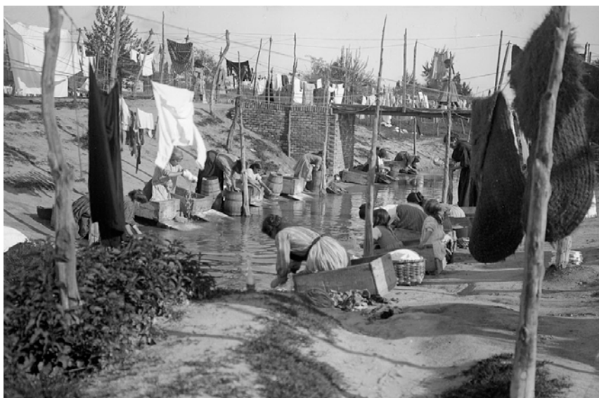
Fig. 9. Lavanderas en el Manzanares. 1914.

importancia de la matanza, ejemplo de esta conservación de alimentos, pero también un momento de sociabilidad colectiva destacado en el calendario. Era habitual que el conjunto de actividades de la matanza reuniese a los vecinos del pueblo, que durante varios días repartían y compartían tiempo y trabajo, fomentando el sentimiento de comunidad y estrechando lazos de solidaridad en una actividad que suponía seguridad frente al invierno.