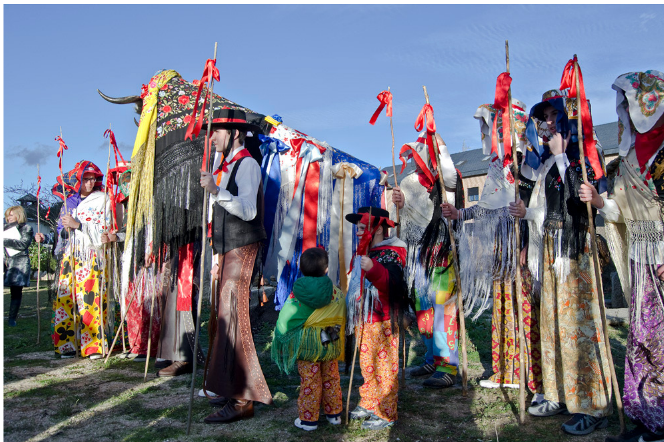
Fig. 4. Grupo de chicos y niños vestidos para la fiesta y vaquilla. Fiesta de la Vaquilla de Pedrezuela. Fotografía Jesús Herrero Marco. 2014

mujeres que siguen salvaguardando estas formas tradicionales de expresión. Su celebración potencia la sostenibilidad de las zonas rurales y contribuye a la salvaguarda del patrimonio cultural.