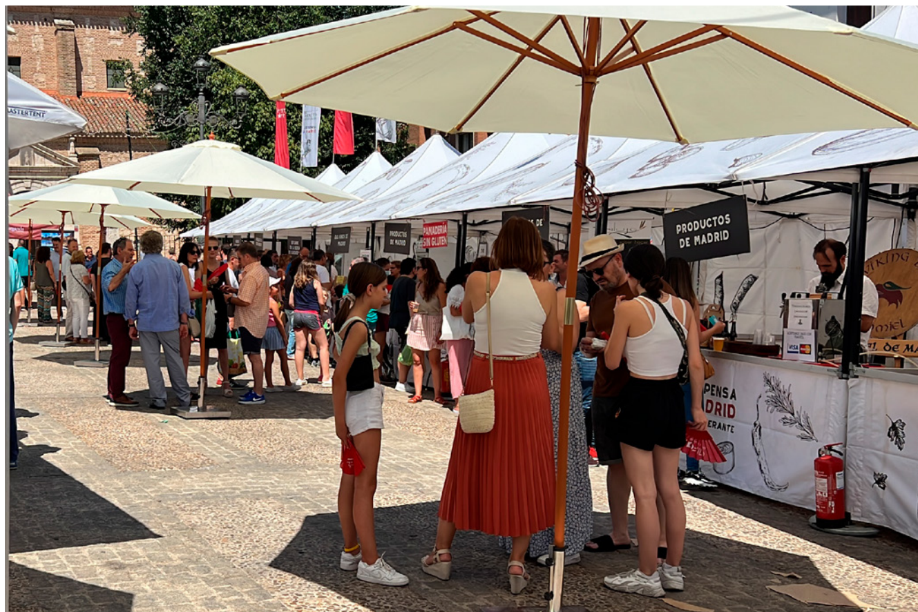
Fig. 1. Mercado La Despensa de Madrid en Arganda del Rey. Comunidad de Madrid

Desde la Administración autonómica se trabaja continuamente para poner en valor estos productos, acercándolos no solo al consumidor final, sino a todo el sector relacionado con la gastronomía, como es el canal HORECA (hostelería y restauración), el comercio minorista y las grandes cadenas de distribución, con el fin de que las empresas agroalimentarias madrileñas se conviertan en uno de sus principales proveedores.