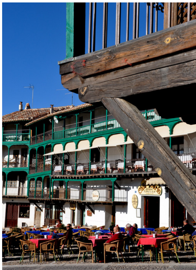
Fig. 7. Detalle de la plaza de Chinchón. 2013

uso de estas construcciones, vinculada a la desaparición de las formas de vida tradicionales. A ello hay que añadir los efectos de la globalización, potenciando la estandarización de tipologías arquitectónicas para las viviendas, el uso de nuevos materiales constructivos y los sistemas de producción industriales, sin olvidar las escasas iniciativas de sensibilización y revalorización en torno a estas arquitecturas.