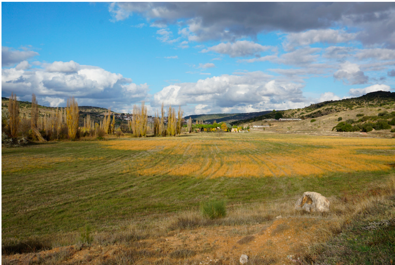
Fig. 1. Campos de cultivo en la vega del río Tajuña (Carabaña). Fotografía Elena Agromayor Navarrete. 2020)

cultural inmaterial está contextualizado en unos marcos temporales de desarrollo muy concretos, decididos a lo largo de su historia en función del calendario estacional, el litúrgico u otros que a menudo quedan fuera de las lógicas capitalistas. Además, las acciones de identificación, protección o difusión toman tiempo, y los organismos responsables de la gestión están a menudo motivados por intereses puntuales que impiden mantener un foco permanente. Para evitarlo, deben respetarse los tiempos de las manifestaciones y no promover las acciones de salvaguardia con unas metas temporales que dependan de factores o intereses externos, sino priorizar las necesidades de la manifestación y de su comunidad portadora. Este reto para la sostenibilidad debe estar presente a lo largo de todo el proceso de salvaguardia del PCI.