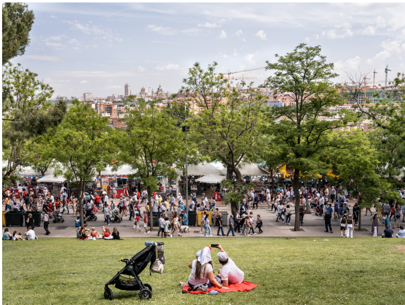
Fig. 4. Madrid. Distrito Carabanchel. Fiesta de San Isidro en la pradera.