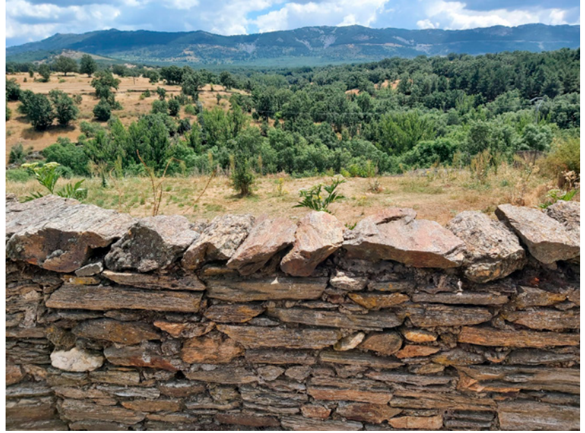
Fig. 2b. Cerca de piedra seca en Montejo de la Sierra. 2022

seca 5 . Esta técnica fue inscrita en la Lista Representativa del Patrimonio Cultural Inmaterial de la Unesco en 2018, y España estaba entre los países que presentaban la candidatura, pero la Comunidad de Madrid no pudo participar en la preparación del expediente al no tener inscrita esta práctica en un inventario o catálogo de patrimonio cultural inmaterial. Los trabajos que actualmente estamos desarrollando permitirían corregir esta circunstancia. En 2021, se realizó la primera campaña de investigación en la sierra del Rincón 6 , que ha continuado en 2022 en los municipios de Somosierra y La Acebeda, elaborando para ello fichas descriptivas georreferenciadas acompañadas de documentación fotográfica de los elementos localizados. De los elementos inventariados se hará una selección de casos representativos para su estudio pormenorizado, que incluirá el levantamiento planimétrico y fotográfico de las construcciones agrícolas y ganaderas relacionadas con las formas de vida tradicionales en esta área de montaña del norte de la Comunidad de Madrid, prestando atención no solo a los aspectos propiamente materiales (localización, morfología, materiales y elementos constructivos), sino también inmateriales (técnicas de construcción, aspectos relativos a la memoria colectiva, etc.). Estos trabajos han dado su fruto con la declaración de la técnica de las construcciones en piedra seca por la DGPC (Resolución, 14 de diciembre de 2022).