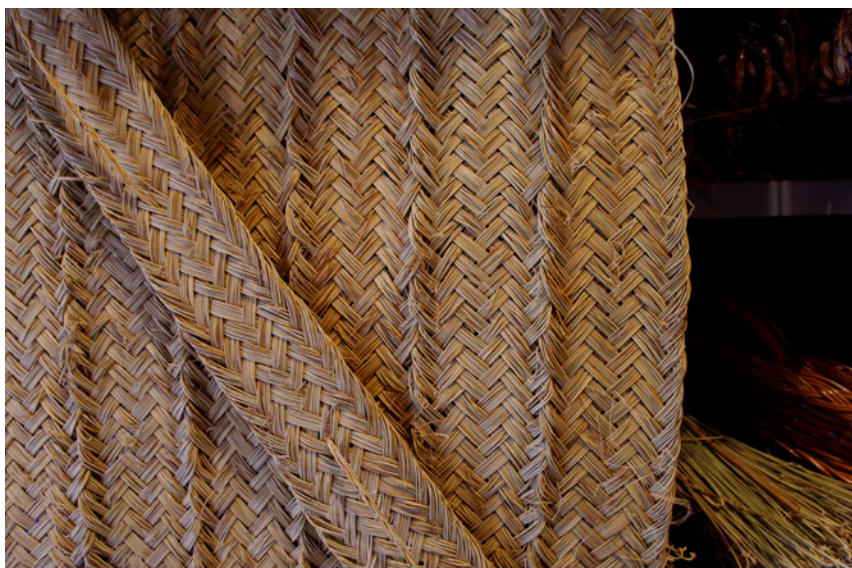
Fig. 8. Estera en primer plano y manojo de hojas de esparto en segundo. Espartería de Juan Sánchez en la calle Mediodía Grande. Madrid.. 2014