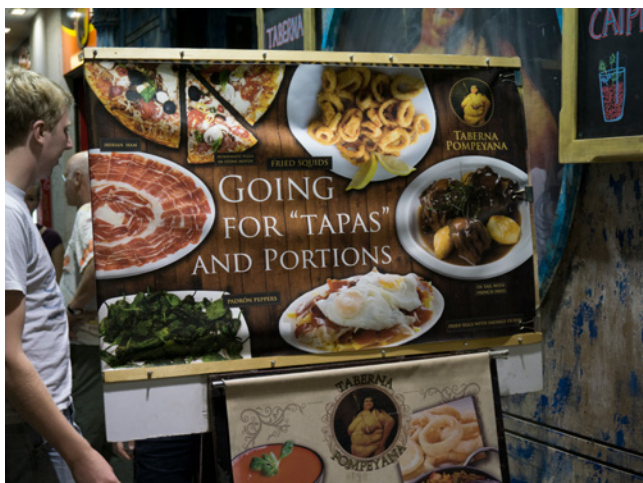
Fig. 2. La mercantilización excesiva puede provocar un grave impacto en el patrimonio inmaterial. Madrid. 2016