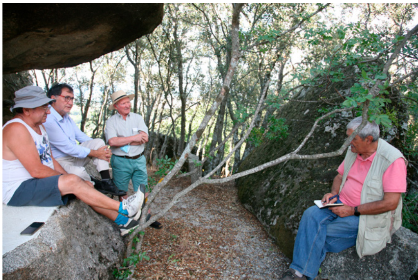
Fig. 1. Trabajo de campo en Finca Marañones. San Martín de Valdeiglesias. 2021