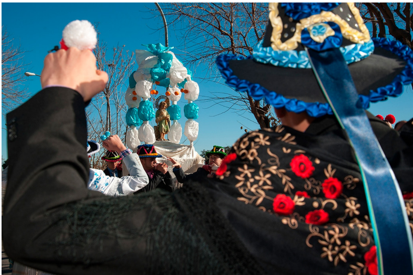
Fig. 5. Costaleras de san Juan Evangelista de Barajas. 2011

San Agustín de Guadalix o Montejo de la Sierra muestran su idiosincrasia a partir de estas formas tradicionales de expresión en las que entran en juego la fe y la devoción desde el plano religioso, pero también la sociabilidad y el mantenimiento de espacios y lugares que ayudan a conservar el patrimonio cultural y natural vinculados a ese tipo de celebraciones, sin las cuales dejarían de tener sentido alguno. Promueven así la concienciación sobre la protección de los espacios naturales donde se desarrollan. Su celebración no solo va asociada a la devoción popular y religiosa en torno a una imagen, sino que su consideración adquiere una dimensión mucho más compleja en torno a parajes naturales. La propia romería de San Isidro en Madrid hace que, cada mes de mayo, una de las ciudades más grandes de Europa albergue una romería popular en su seno, en un espacio que el imaginario colectivo ya considera sagrado e intocable, permitiendo el mantenimiento de un importante pulmón verde para la ciudad.