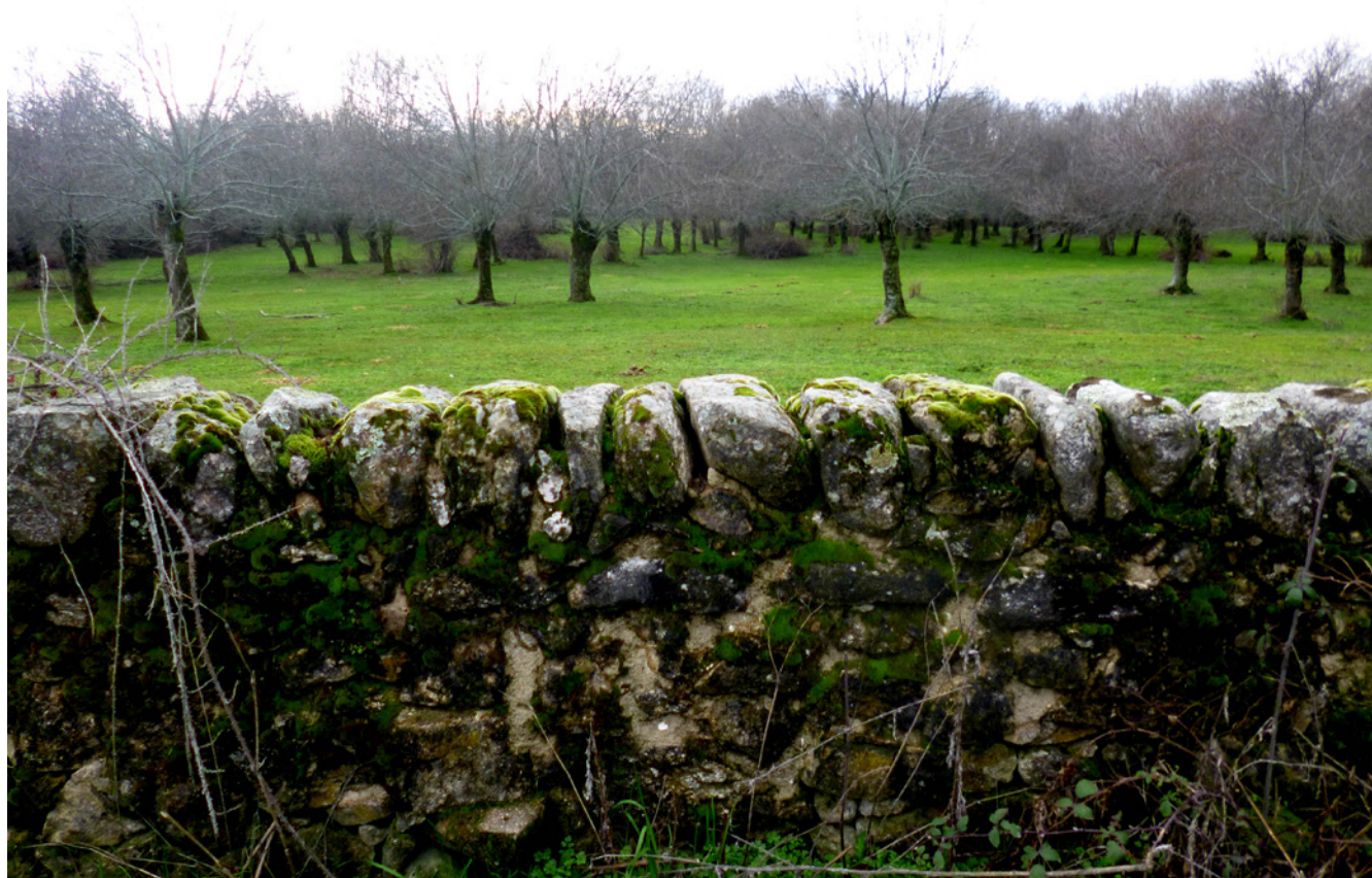
Fig. 1. Dehesa en Soto del Real con cerca de piedra en seco en primer plano. 2017. Fotografía Antonio Agromayor Arredondo

terreno, mejora su estabilidad al evitar su erosión por la escorrentía superficial del agua y contribuye a disminuir el riesgo de propagación de incendios (condición extrapolable a la red de cercados) gracias, por un lado, a la discontinuidad que marcan en el paisaje y, por otro, al uso agropecuario del campo que reduce la densidad arbustiva más inflamable 6 .