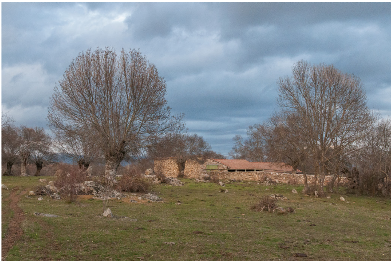
Fig. 4. Los usos tradicionales configuran paisajes culturales singulares que, en la actualidad, se han convertido también en espacios de ocio. Es necesario garantizar un correcto equilibrio entre ambos usos para garantizar su preservación. Villavieja de Lozoya. 2017

procesos de activación turística. Estamos hablando de una actividad económica que tiene una metodología de producción, unos procesos operacionales y unas necesidades de resultados. Una realidad que debe ser conocida por los anfitriones, ya que son elementos necesarios para que el desarrollo turístico sea viable. El desconocimiento del contexto del turismo puede hacer que se apueste por planteamientos imposibles de llevar a la práctica o de alcanzar los resultados necesarios para que sea viable; el turismo trabaja para un mercado y, por tanto, tiene que dar una adecuada respuesta al mismo.