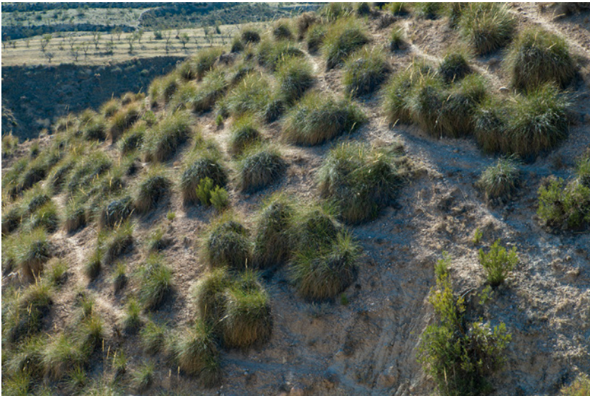
Fig. 2. Un espartizal. Fotografía: Pascal Janin. 2017