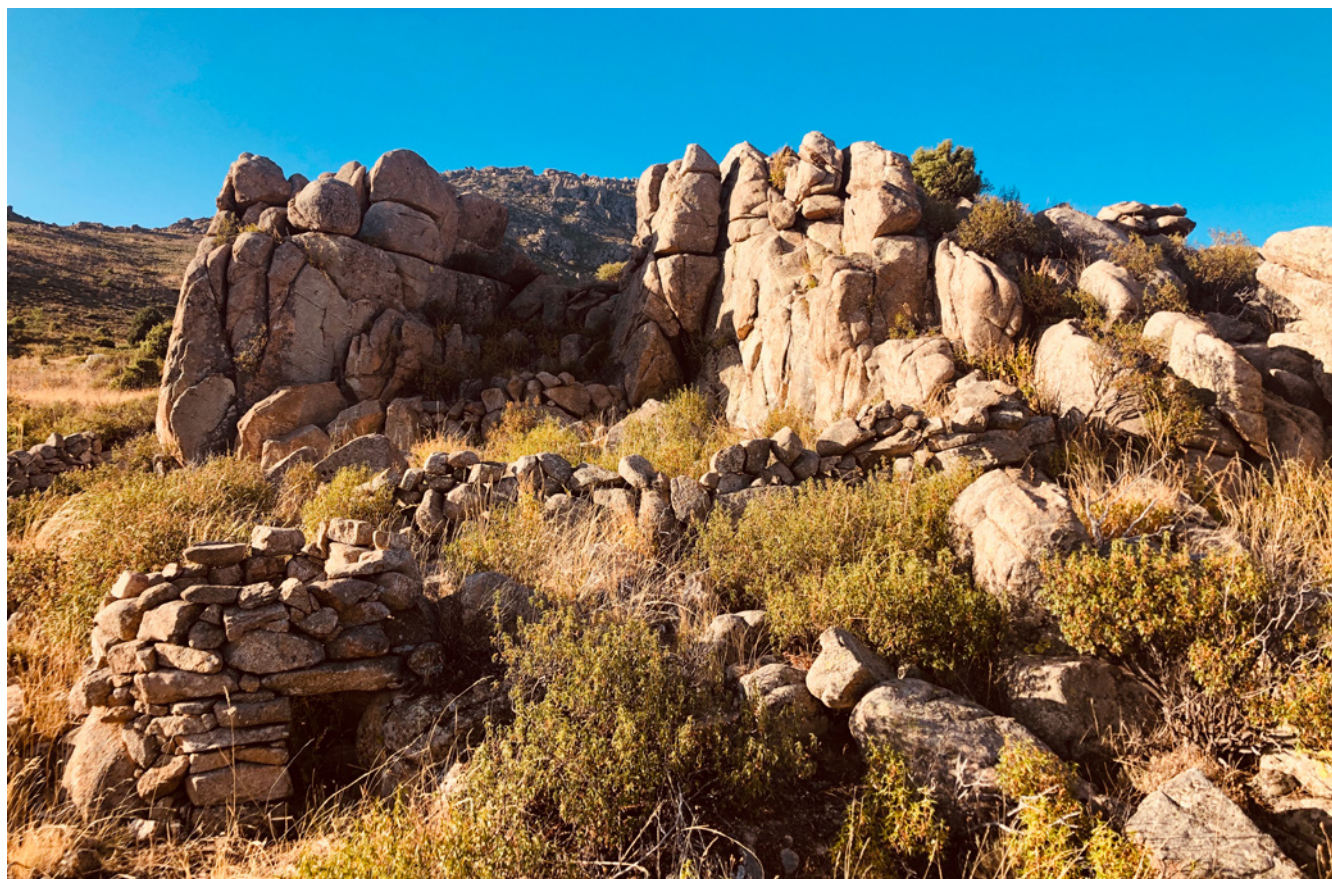
Fig. 4. Restos de muros de majada con chivero en las laderas de la Maliciosa. Mataelpino.

El 11 de enero de 2015, la pérdida de ochenta cabras guadarrameñas en un rebaño de San Mamés, localidad del valle de Lozoya, puso en alerta a todos estos agentes implicados, y una semana después representantes de colectivos conservacionistas como REFORESTA y RED MONTAÑAS, el Observatorio para la Conservación del Territorio y los Ayuntamientos de El Boalo y de Miraflores de la Sierra se daban cita en una reunión nocturna en el céntrico Café Comercial de Madrid en torno al biólogo Juan Carlos Blanco para analizar la gravedad de la situación y crear un grupo de trabajo que aportara información, soluciones y recursos para los ganaderos afectados con carácter de urgencia.