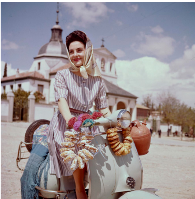
Fig. 5a. Pradera de San Isidro. 1932