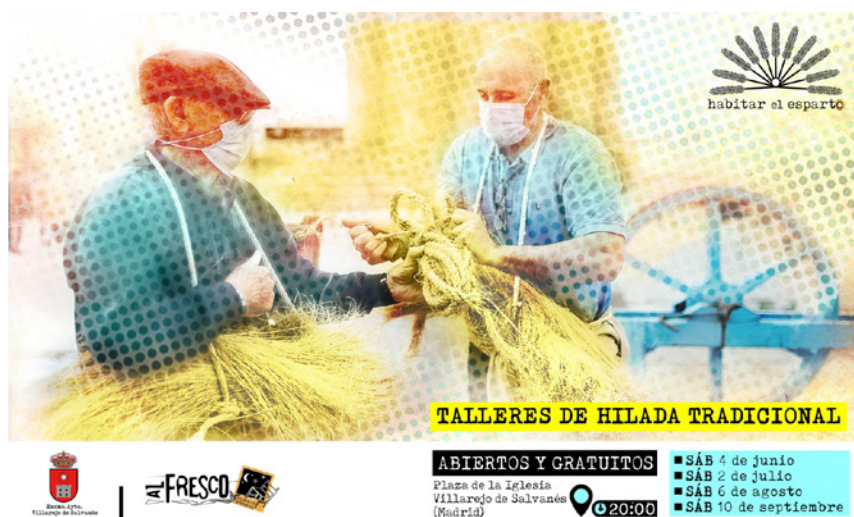
Fig. 5. Cartel anunciador de los talleres de hilada tradicional organizados por la asociación Al Fresco-Museos Efímeros (Diseño: Esther San Vicente, 2022 sobre una fotografía de Elena Campos)

Desde hace una década, pues, hemos asistido a un desplazamiento del centro de gravedad alrededor del cual se articulaban las distintas comunidades