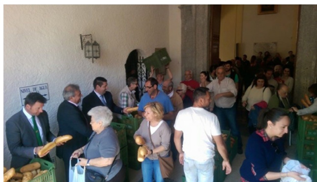
Fig. 7. Día de la Caridad de la Virgen de la Poveda en Villa del Prado, castillo humano andante y reparto de panes.

fiesta, que en la actualidad tiene la máxima protección, en los años setenta tuvo un periodo de recesión al no implicarse en la participación las nuevas generaciones de la localidad. Fue necesario el impulso de las personas de mayor edad para animar a un grupo de jóvenes a seguir con la tradición. A partir de ese momento el castillo humano se ha realizado todos los años, destacando la novedad de la participación femenina.