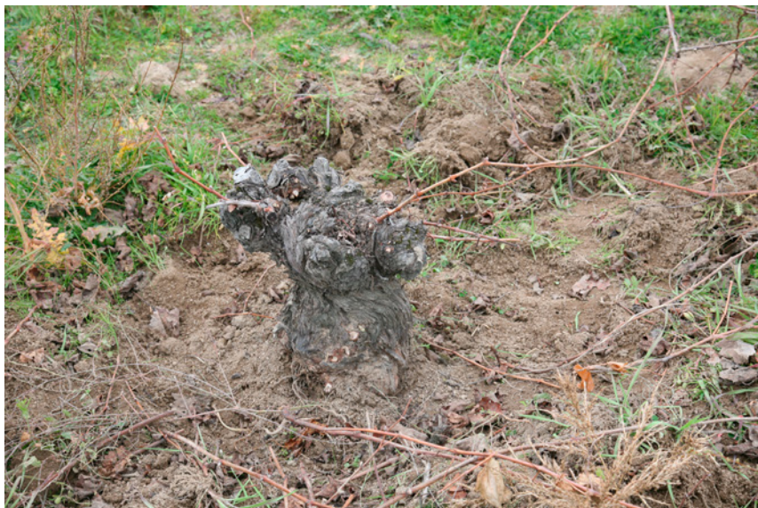
Fig. 3. Cepa de garnacha. San Martín de Valdeiglesias. 2021