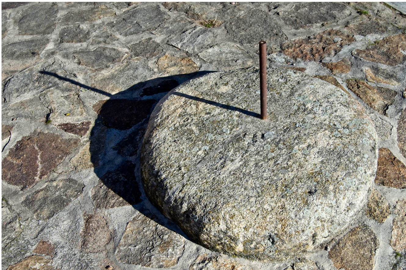
Fig. 11. Piedra de «las veces» o reloj de turnos para el agua del riego. Gandullas. 2013

como en Navarredonda, Gandullas, La Serna del Monte, Madarcos y Aoslos. (Fig. 11).