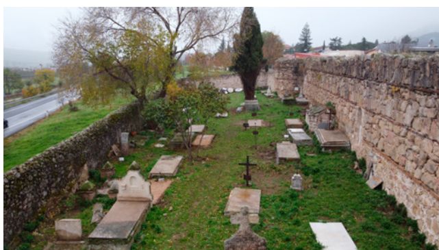
Fig. 3a. Estado del Cementerio Viejo de Manzanares el Real antes de la intervención de conservación-restauración de 2022.