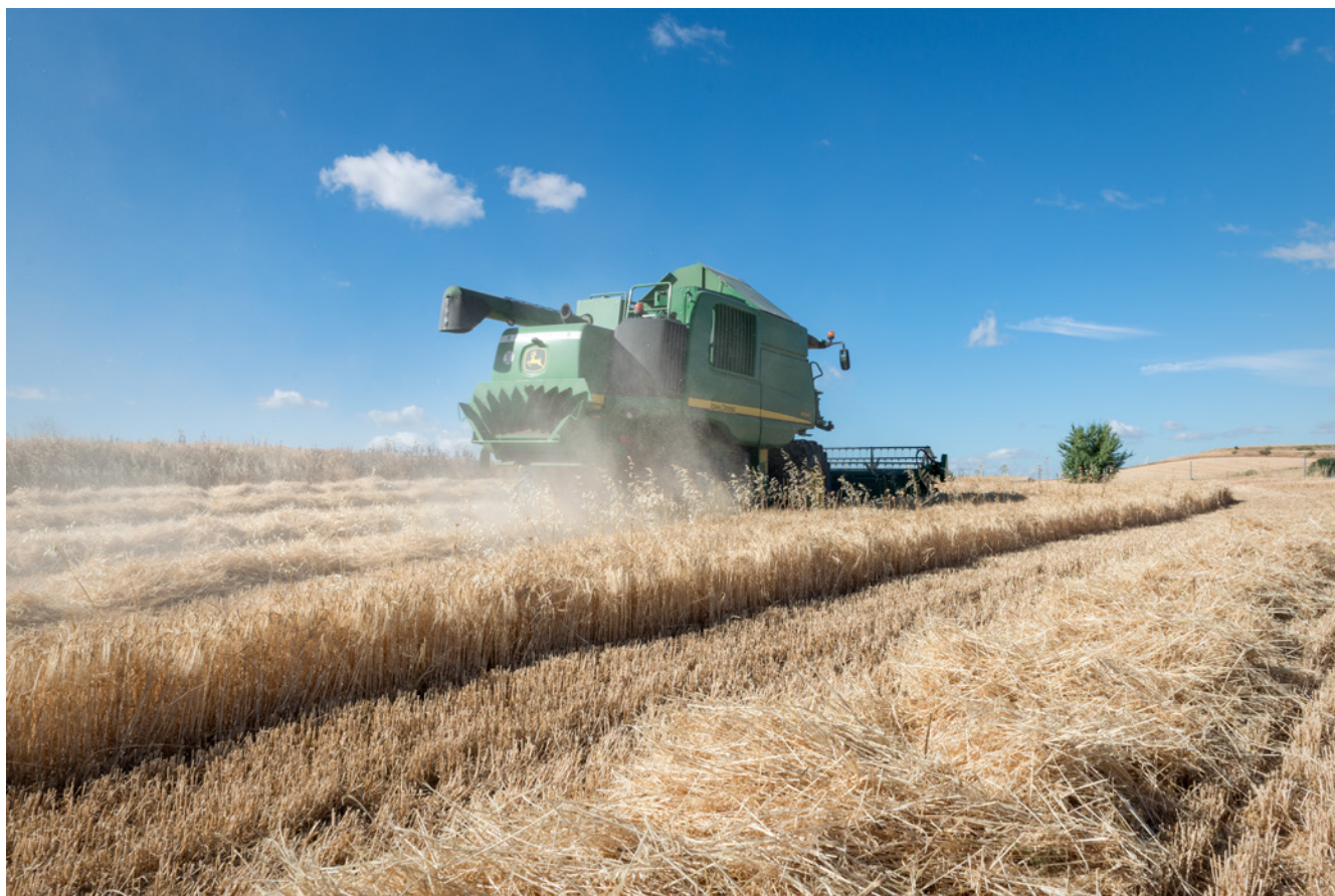
Fig. 2. Labores de siega. Ajalvir.

y patrimonio cultural. La identificación con su pasado visigodo ha ido creciendo a través de los vínculos afectivos construidos gracias a la implicación de profesionales, a las asociaciones y empresarios locales y también a los vecinos. Además de las actividades del propio yacimiento, y de interpretación y educación, se han consolidado otras externas, como las jornadas del Noviembre Visigodo o la promoción de artesanos y artistas locales.