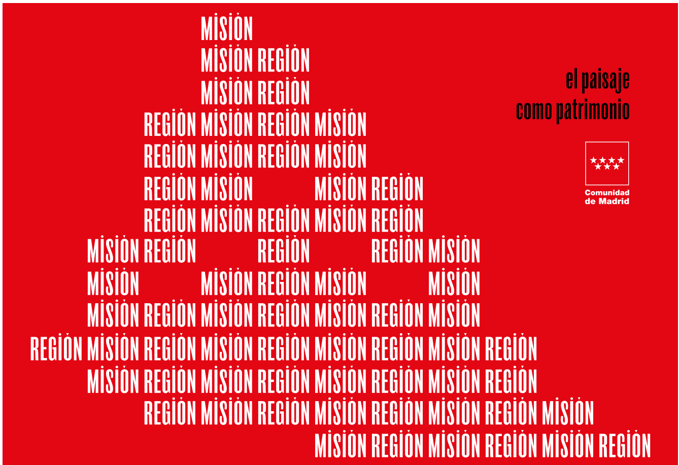
Fig. 3. Misión Región. 2022

Inmaterial, Etnográfico e Industrial de la Comunidad de Madrid. Con esta iniciativa se pretende sumar a las personas y grupos sociales portadores del patrimonio inmaterial en la propia definición de este. Y para ello se ha contado con asociaciones culturales implantadas territorialmente, que han canalizado la participación de aquellas personas que mejor conocen el patrimonio inmaterial. De esta forma, bajo la coordinación científica de los técnicos de la Dirección General de la Comunidad de Madrid, se ha involucrado a las asociaciones y a las personas en el inventariado de bienes inmateriales, mejorando su conocimiento y fomentando el protagonismo de la ciudadanía.