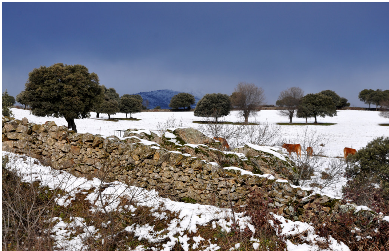
Fig. 4. Dehesas en piedemonte. Guadix de la Sierra. 2019

comunal, quedando actualmente regladas en la figura de Montes de Utilidad Pública, aunque también encontramos montes y dehesas de uso exclusivamente privado delimitados por cercas en zonas próximas a los núcleos rurales. (Fig. 4).