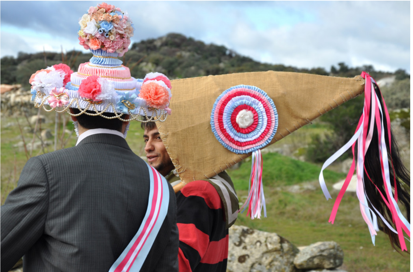
Fig. 12. Alcalde y Vaquilla de la fiesta de Fresnedillas de la Oliva. Fotografía Elena Agromayor Navarrete. Fotografía Jesús Herrero. 2013

influencia de la capital. En este sentido, ha sido la sociedad civil la principal responsable de la continuidad o, en algunos casos, de la recuperación o revitalización de determinados rituales identitarios. (Fig. 12).