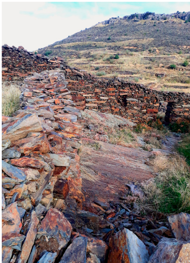
Fig. 3. Conjunto de corrales y eras abancaladas en Patones de Arriba. 2018

La agricultura en la zona norte de la Comunidad de Madrid 18 ha tenido históricamente menos importancia que la explotación ganadera debido a la infertilidad del terreno y a la dificultad que tenían muchas poblaciones para disponer de agua durante todo el año. Ya el Catastro del marqués de la Ensenada se refiere a ella como pequeñas producciones de cereal, principalmente centeno y trigo, leguminosas, hortalizas, lino y árboles frutales, como nogales, perales y ciruelos 19 . Aun así, el paisaje muestra, a través de la parcelación de los terrenos, la fisonomía de sus cultivos, las infraestructuras y las construcciones asociadas a la agricultura, la presencia de esta actividad de subsistencia. Las antiguas ordenanzas regulaban el tipo de cultivo, estableciendo las técnicas y los regímenes temporales de aprovechamiento. Las huertas y los linares ocupaban los terrenos del entorno más inmediato de los núcleos rurales, quedando delimitados por un ruedo de pequeñas parcelas privadas cercadas con mampostería de piedra, y en segundo término se encontraba el resto de los cultivos de regadío o de secano, construyendo un paisaje en mosaico. Algunos de estos cultivos eran compatibles con la ganadería, llegándose a dar las dos actividades simultáneamente al servir como pastizales. Municipios como Gascones,