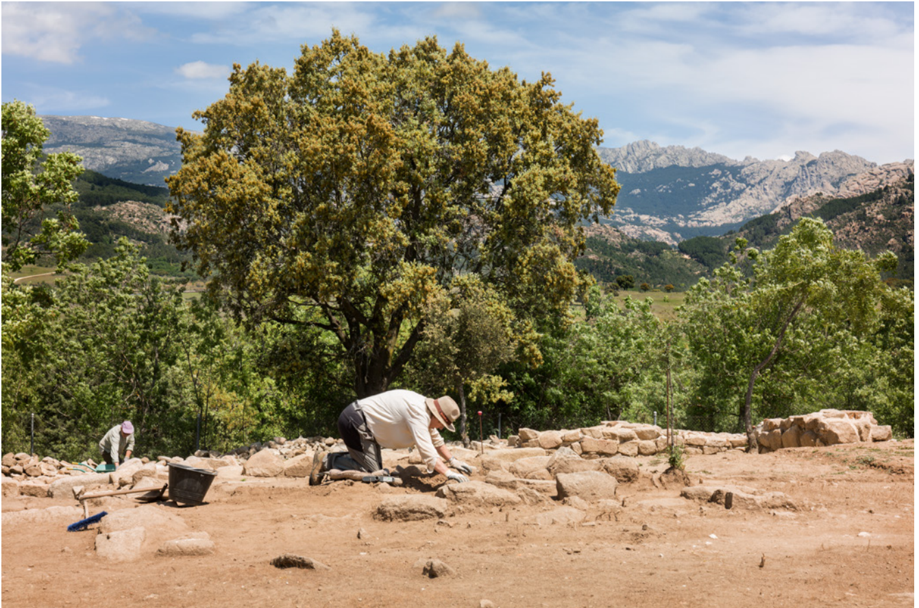
Fig. 1. Yacimiento de El Rebollar. El Boalo.

La aproximación a través de la selección de buenas prácticas tiene sentido porque las respuestas a cada situación no son comunes y los procedimientos no pueden aplicarse de la misma manera. Es una forma de entender que las soluciones deben ser adaptadas y flexibles a circunstancias, contexto y objetivos específicos.