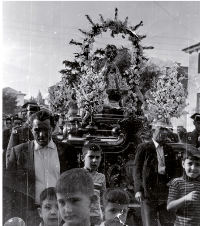
Fig. 6a. Varios vecinos trasladando la Virgen de Alarilla. Fuentidueña de Tajo. 1960

A partir de esta declaración se ha planteado un programa de declaraciones de PCI. En 2022, les tocó el turno a otras dos manifestaciones: la primera de ellas es la Procesión de la Virgen de Alarilla, en Fuentidueña de Tajo (BOCM, n.º 74, 28 de marzo de 2022). Cada año, el segundo domingo de septiembre se celebra la fiesta en honor a la patrona de la localidad. Durante doce días se la festeja con diversos actos, pero el más espectacular y el que todos los vecinos y visitantes esperan con ilusión es «la embarcación». El sábado, víspera del día de la Virgen, se lleva en romería la imagen a la ermita. A la vuelta, esa noche, desciende en comitiva fluvial, con la imagen presidiendo una balsa engalanada con casi dos mil bombillas de