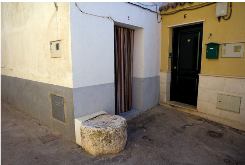
Fig. 3. Piedra de picar esparto ubicada en la entrada de una vivienda de la Calle Tres Casas, en Colmenar de Oreja. 2011