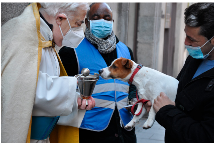
Fig. 4. Fiesta de San Antón (Madrid). 2021