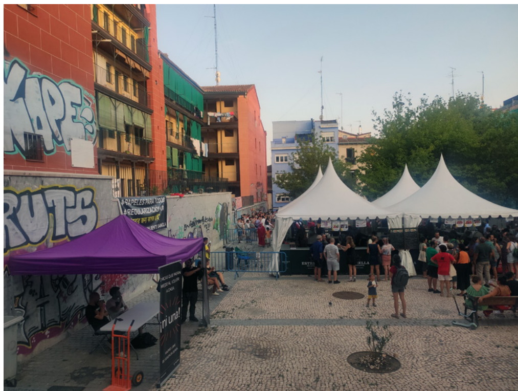
Fig. 3. Plaza de la Corrala de Tribulete durante la verbena de San Lorenzo.