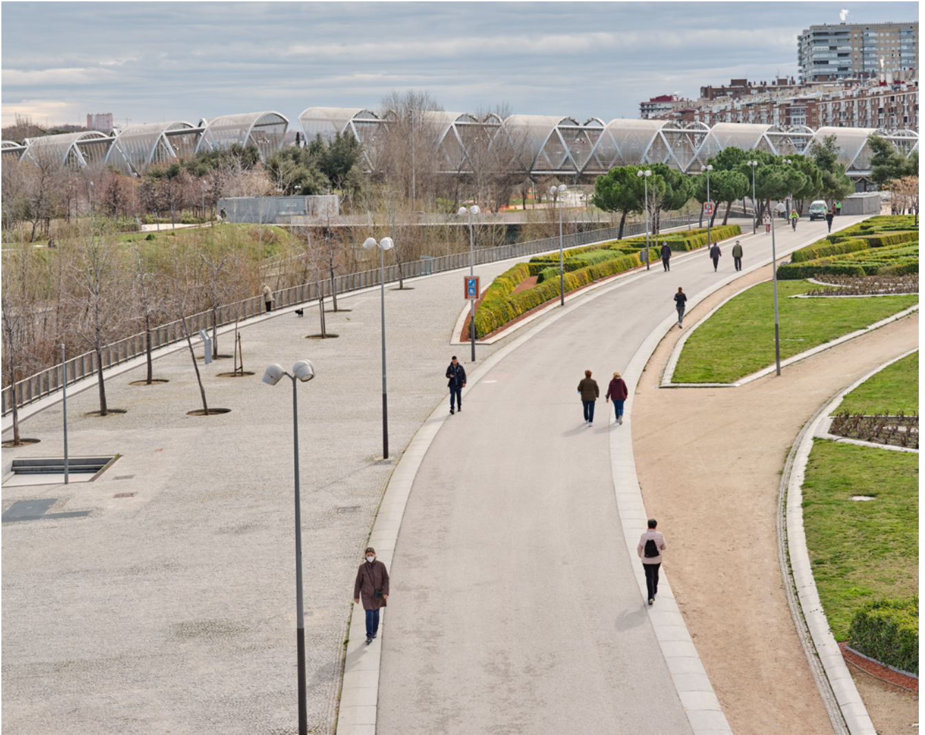
Fig. 1. Madrid sin ti. Arganzuela. Fernando Maqueira.

instituciones culturales) «se digitalizara», cobrando nueva vida a través de internet y las redes sociales, como si buscara el oxígeno necesario para mantener su respiración: el contacto con las personas.