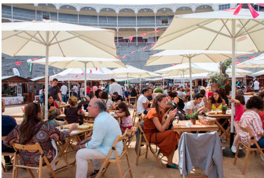
Fig. 4. Zona de degustación #Comete las Ventas. Comunidad de Madrid

páginas webs, y hacer inserciones publicitarias en sus publicaciones municipales. Igualmente, toda la información de los mercados, así como los lugares y fechas de su celebración, se difunde por el organismo administrativo promotor del proyecto, a través de la web institucional ( comunidad.madrid ), la propia web de la marca M PRODUCTO CERTIFICADO ( www.mproductocertificado.es ) y en sus perfiles de las redes sociales en Facebook ( Madrid.Calidad ), Instagram ( madridcalidad ) y Twitter ( @MadridCalidad ) y de la app de Alimentos de Madrid.