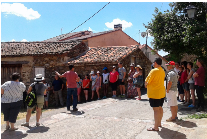
Fig. 4. Mapa Emocional. La Casana. 2018

conseguir cosas que queríamos que sucedieran mañana. Tuvimos que planificar. Nos dimos cuenta de que, a la hora de diseñar una programación, no estábamos solos. Quizás no había muchos ejemplos donde aprender, pero teníamos un margen muy amplio para diseñar.