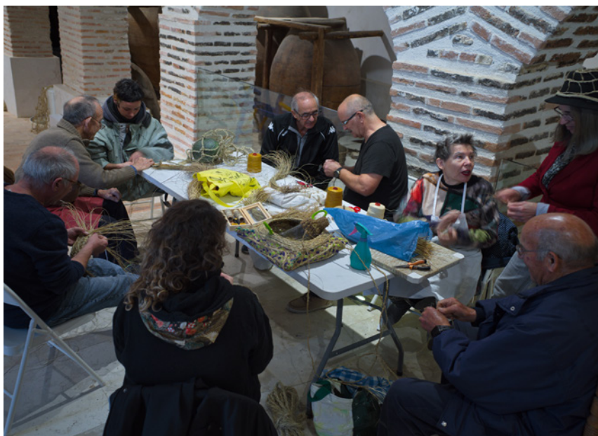
Fig. 3. Corro espartero.