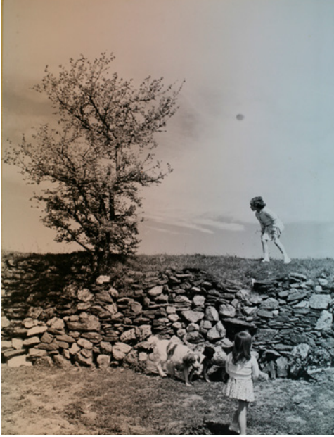
Fig. 2a. Las hijas de mi cuñado. Montejo de la Sierra. Archivo Regional de la Comunidad de Madrid, Colección Madrileños. 1970