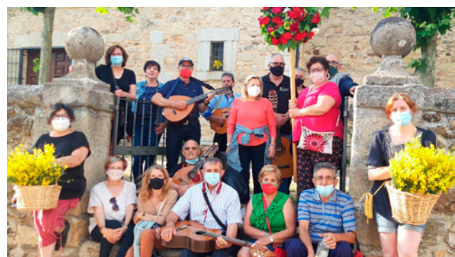
Fig. 4a. Empleados de la finca de Santuy. La Hiruela. 1955