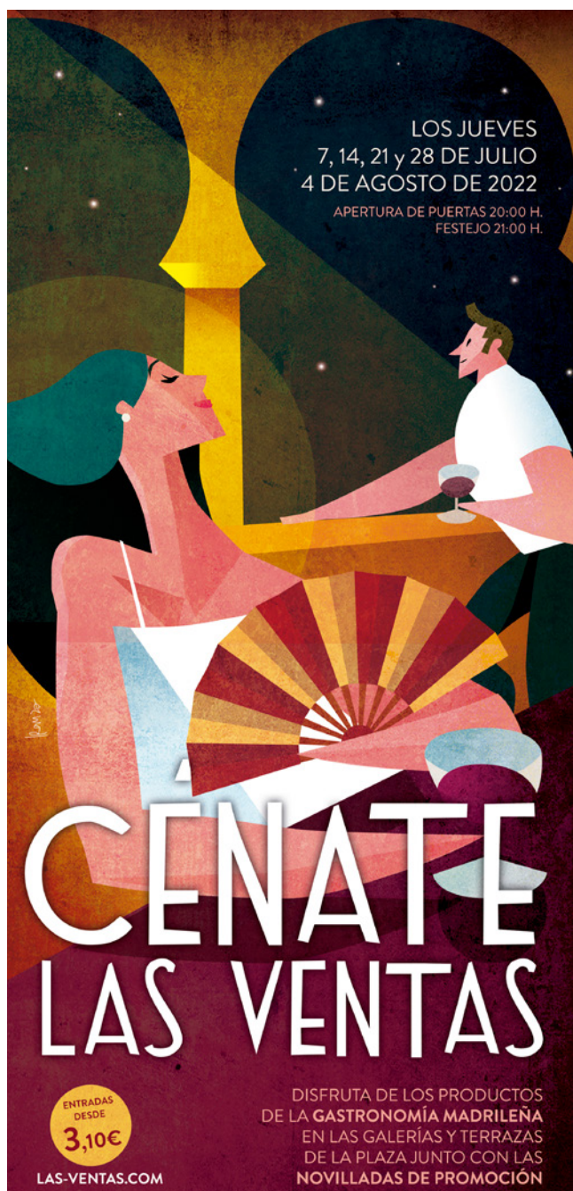
Fig. 5. Cartel Cénate Las Ventas. Comunidad de Madrid

actividades al aire libre, que pueden convertirse en costumbres sanas con el tiempo. Igualmente, se afronta la importancia de consumir productos de cercanía y, por último, la importancia de la separación de residuos.