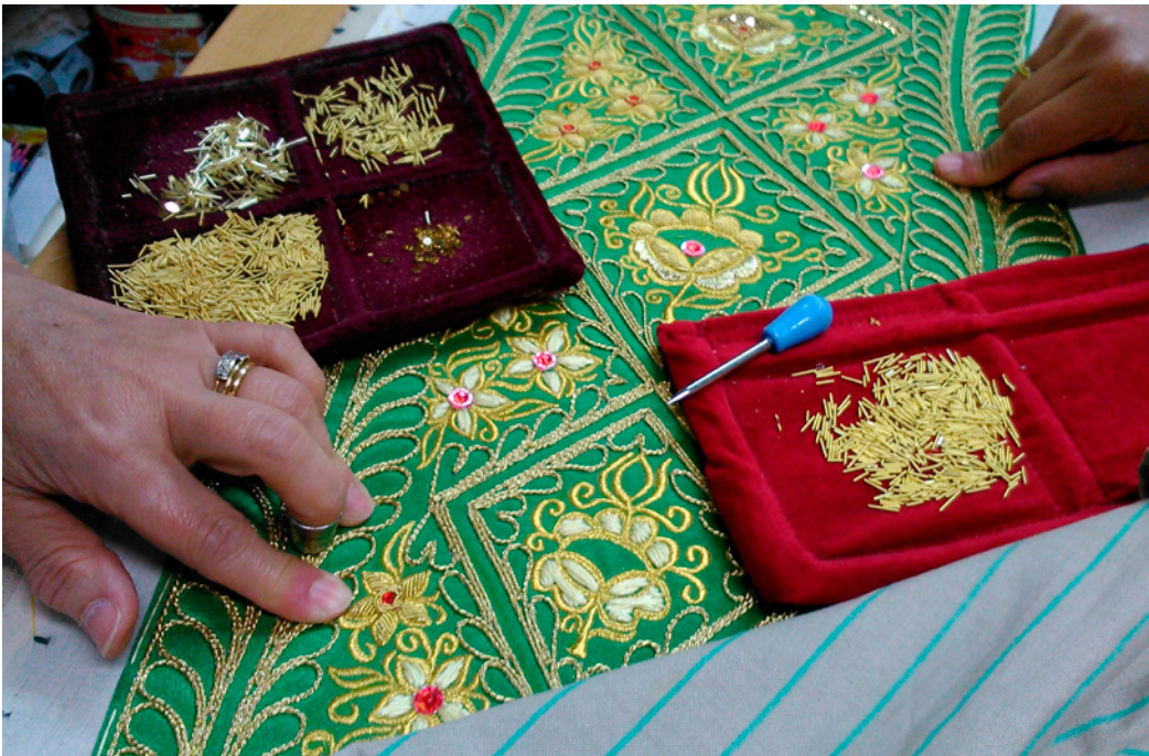
Fig. 2. Bordado en un traje de luces. Sastrería Fermín. Madrid. 2014