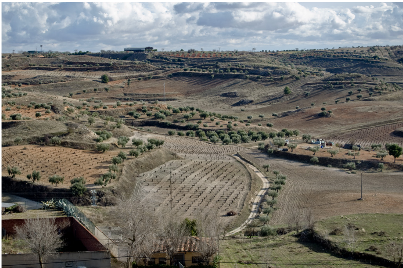
Fig. 4. Sistemas agrícolas de aprovechamiento diversificado. Colmenar de Oreja. Fotografía Jesús Herrero. 2014

que sus manifestaciones no son estancas. Muy al contrario, los diversos ámbitos se encuentran profundamente interconectados. Prueba de ello es la trashumancia, una actividad ganadera con implicaciones culturales, medioambientales y sociales, y con todo un cúmulo de conocimientos sobre técnicas agropecuarias, veterinarias o meteorológicas.