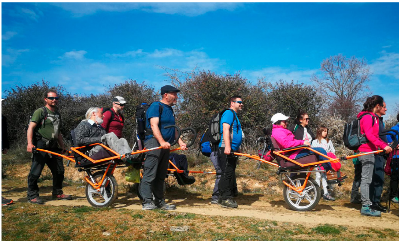
Fig. 5. Imagen de senderistas en Joellet. Vereda y Villa. 2019

horno de pan y arco mudéjar. En todos ellos hay una persona que narra todo lo que pasaba en ese punto emocional y se facilita una hoja con información relevante del elemento que se visita. En estos puntos, en la medida de lo posible, se vuelven a activar distintos elementos y así, por ejemplo, en la fragua se pone en marcha una fragua manual, mientras que en el lavadero se ha elaborado jabón en alguna ocasión, y lo mismo ha sucedido con el horno de pan. El objetivo es acercar el hecho cultural y para ello se encarna y se vivencia. El arco mudéjar lo explica una vecina del pueblo que es historiadora. En el potro de herrar se llevan varios elementos para recrear y que se visualice lo más realmente posible lo que allí sucedía. Las exposiciones que se muestran, en algunos casos, también se narran, introduciéndose así un componente de transmisión verbal, no solo visual. No son estáticas. El campo de la palabra compartida abre la opción a un intercambio activo. Los portadores, ya sea en el mapa emocional, en una exposición o en una obra de teatro, no narran de manera unidireccional, sino que dialogan con las personas visitantes. La transmisión queda así reforzada, se produce un vínculo. Igualmente sucede en el campo de la accesibilidad. Desde hace varias ediciones, para la senda guiada se han introducido, vía convenio con el Ayuntamiento de Lozoya y la Asociación Roblemoreno (propietario y entidad gestora), sillas Joëlette. Se abre así la posibilidad para