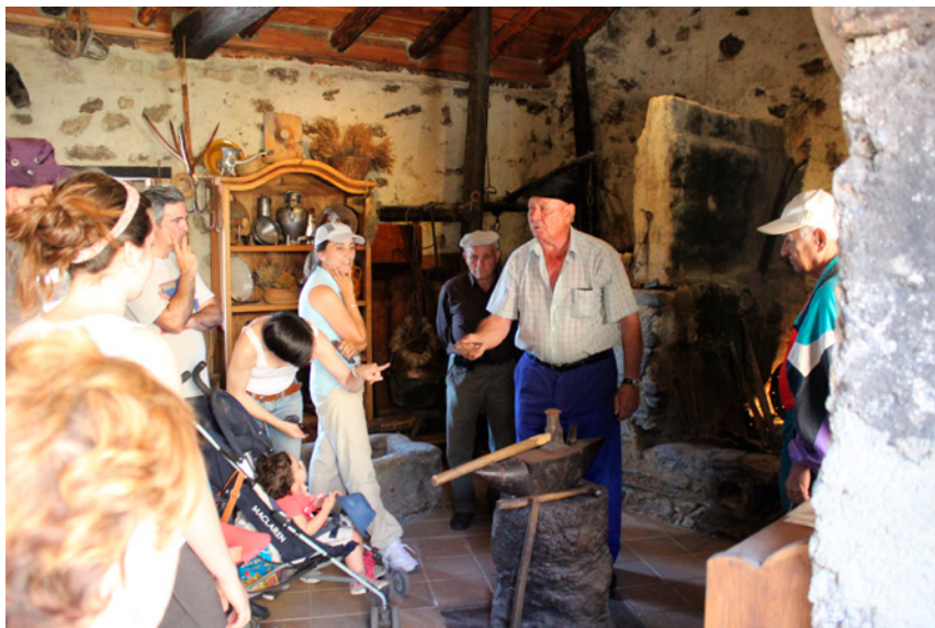
Fig. 3. Mapa Emocional. La fragua. 2019