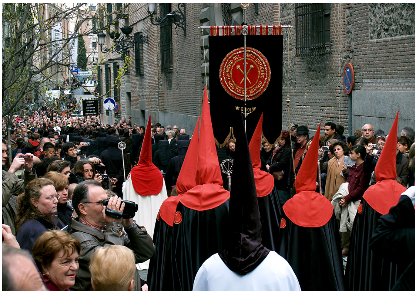
Fig. 14. Hermandad del Santo Entierro de Móstoles que también procesiona en Madrid capital. 2015

lograr una mayor igualdad e inclusión. De esta manera, en la actualidad, en el seno de las comunidades portadoras —a través de asociaciones, agrupaciones, peñas, hermandades y cofradías— se están abriendo espacios de diálogo que están permitiendo una paulatina incorporación de las mujeres a los roles ejercidos tradicionalmente por los hombres, evidenciándose también una mayor sensibilidad frente a la discriminación y el respeto a la diversidad. Así, hermandades y cofradías superan sus objetivos de carácter religioso para cumplir otras funciones sociales, modificando sus dinámicas internas y su proyección al exterior 22 . Es el caso de los Castillos Humanos Andantes de Villa del Prado, donde, desde hace varios años, las mujeres, tanto adultas como jóvenes, han empezado a formar parte también de estas expresiones.