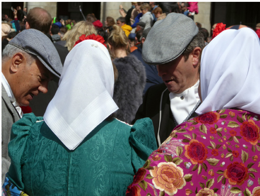
Fig. 3. Fiesta de San Isidro, Plaza Mayor de Madrid. 2017