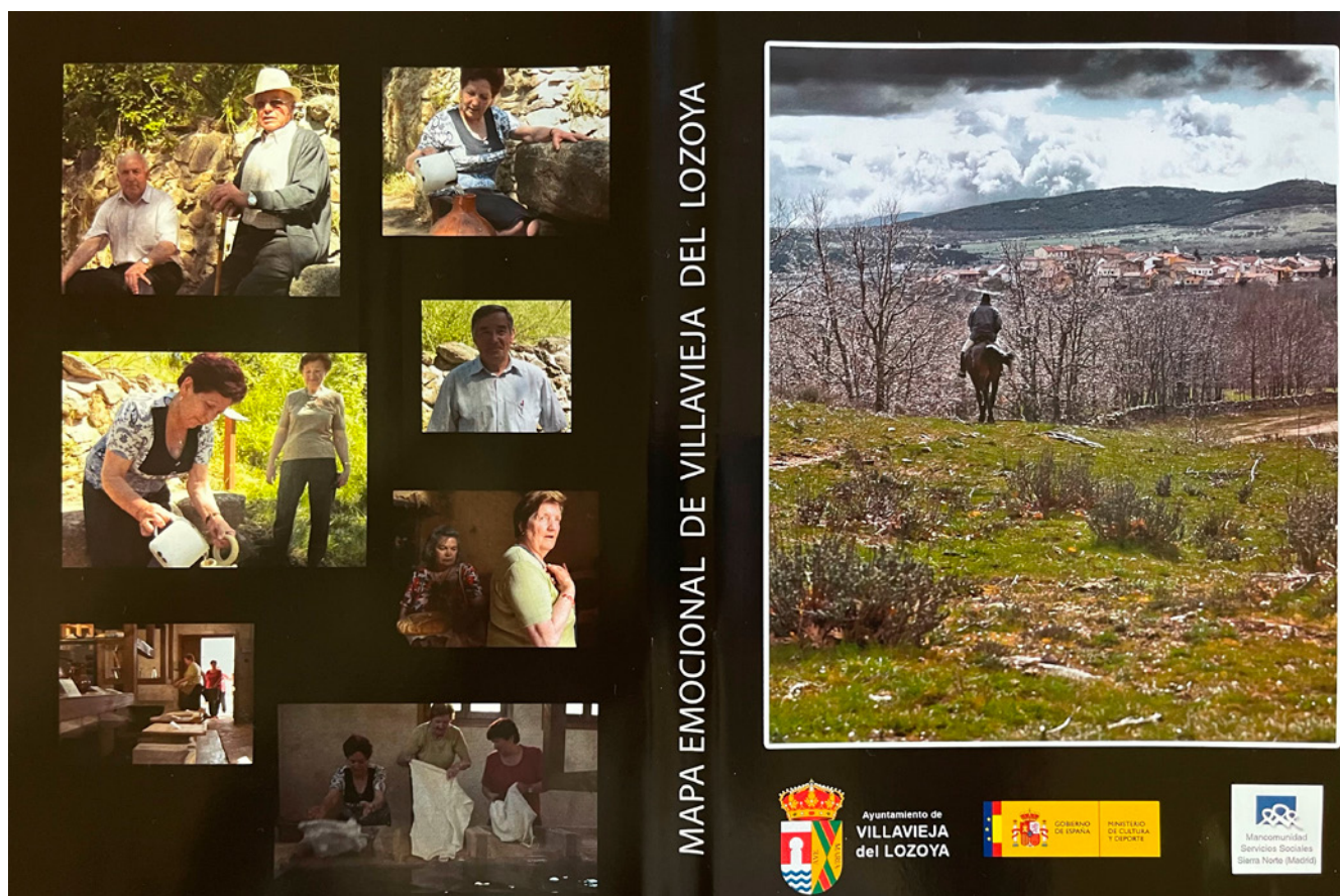
Fig. 1. Portada del DVD editado. 2012

embargo, no solo se ven, sino que permanecen señalados durante todo el año. Están, de hecho, ambientados museográficamente. De algunos otros, como el potro de herrar, solamente se puede ver la estructura de piedra. El último punto de nuestro mapa emocional, un arco mudéjar, está integrado en una infraestructura municipal hostelera. Todos estos puntos, geográficamente emocionales, permanecen irónicamente a día de hoy mudos. La ironía es que, mientras hoy permanecen en silencio, hace unos años todos estos puntos constituían el eje central de la vida social y económica no solo de Villavieja del Lozoya, sino de todos nuestros pueblos. Tanto es así que las personas que los vivieron y protagonizaron son quienes ahora, cuando nos cuentan todo lo que allí acontecía, les hacen cobrar vida.