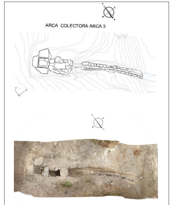
Fig. 1b. Planimetría y vista cenital de la conducción 2 del sistema hidráulico de El Juncarejo. Moralzarzal. 2022

pueblos vecinos, anexionándose los, convertidos en barrios de la capital: Vallecas y Barajas pueblo, Vicálvaro, Hortaleza, Tetuán de las Victorias, etc. En todos ellos existen potentes asociaciones culturales empeñadas en preservar su antigua idiosincrasia municipal. Estamos convencidos de que la implementación de todos estos datos en la Base de Datos de Patrimonio Inmaterial, Etnográfico e Industrial otorga a este inventario un uso como herramienta social de una forma más creativa (siempre desde una perspectiva antropológica) que ayudará a un mejor funcionamiento de nuestra propia sociedad. Creemos que inventariar toda la cultura disponible (tanto la que todavía sigue en uso como la olvidada, pueda esta resurgir o no en un futuro, con todos los cambios necesarios para amoldarse a los nuevos usos sociales) puede ayudar a resolver problemas actuales, con fecha de caducidad, sirviendo para recontextualizar vías culturales e imaginando nuevos usos sociales y culturales. La antropología puede actuar como mediador cultural.