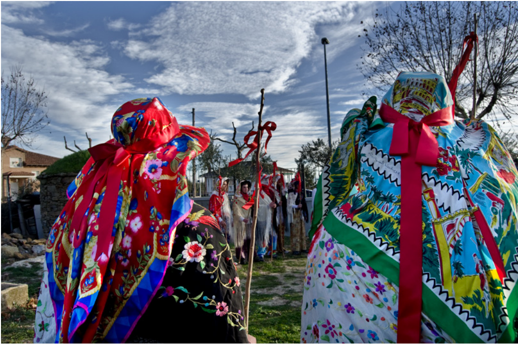
Fig. 1. Fiesta de la Vaquilla de San Sebastián en Pedrezuela. 2014