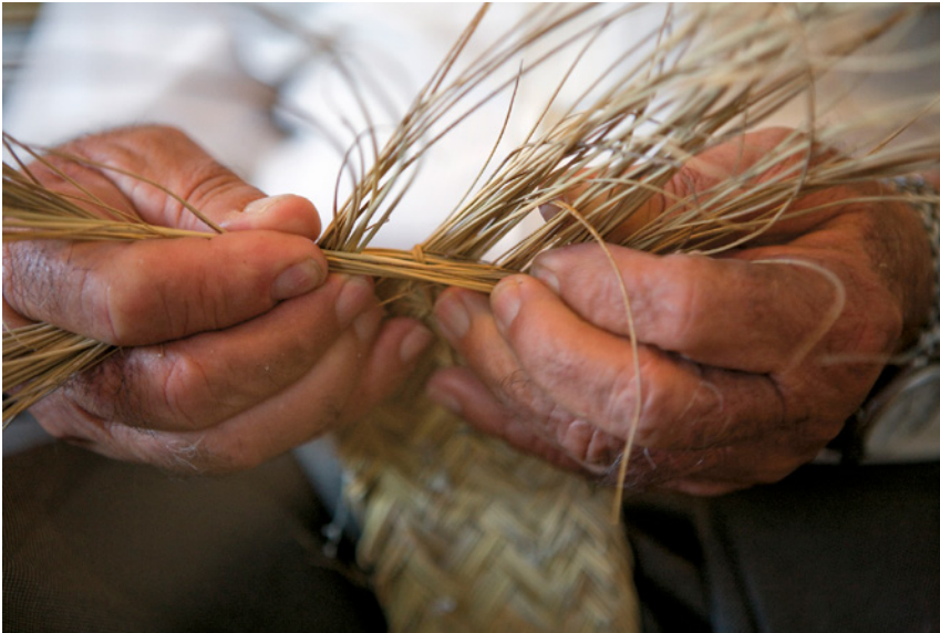
Fig. 1. Trezando una pleita de esparto: el ejercicio del arte de la espartería constituye la principal manifestación inmaterial de la Cultura del Esparto. 2011