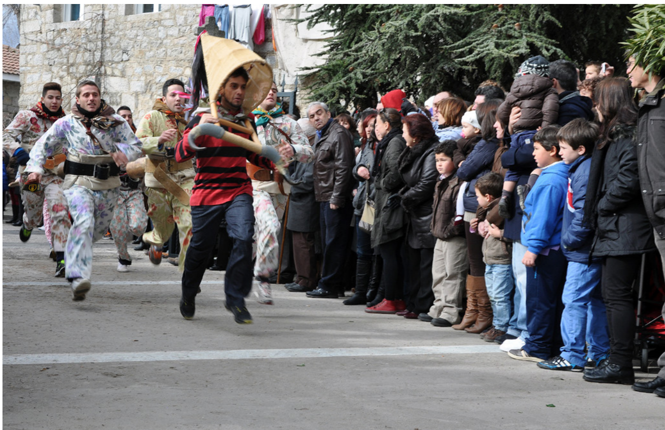
Fig. 1. La fragilidad del patrimonio inmaterial obliga a ser respetuoso con las acciones de activación turística. El respeto a las comunidades portadoras debe ser un factor determinante en estos procesos. Fresnedillas de la Oliva.

tiene de nuestra identidad desde los centros emisores de turismo» 11 .