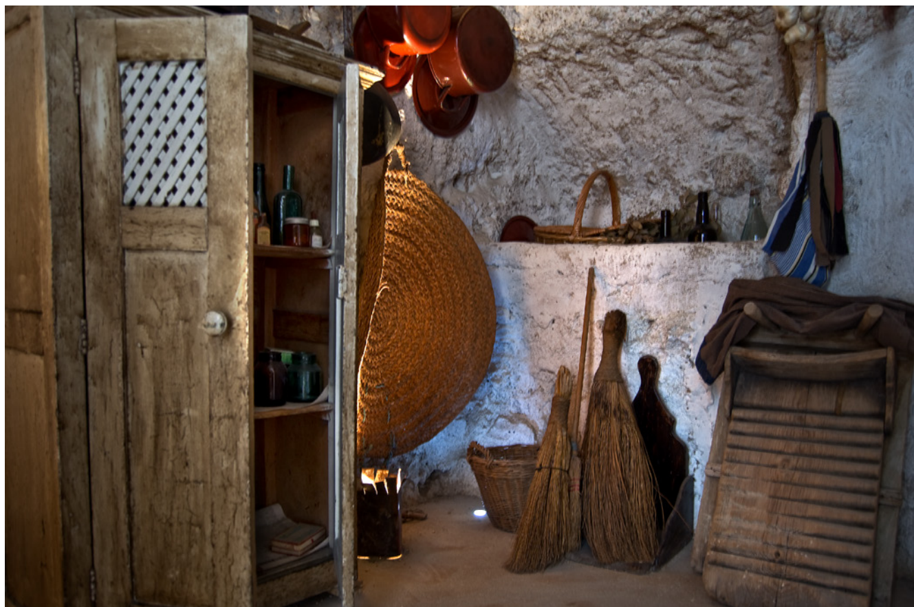
Fig. 6. Casa Cueva Musealizada, Tiernes. 2014

tanto en el autóctono como en el foráneo. El objetivo de la sostenibilidad social es fundamentalmente el bienestar de la población, a través de una sociedad inclusiva, cohesionada y participativa.