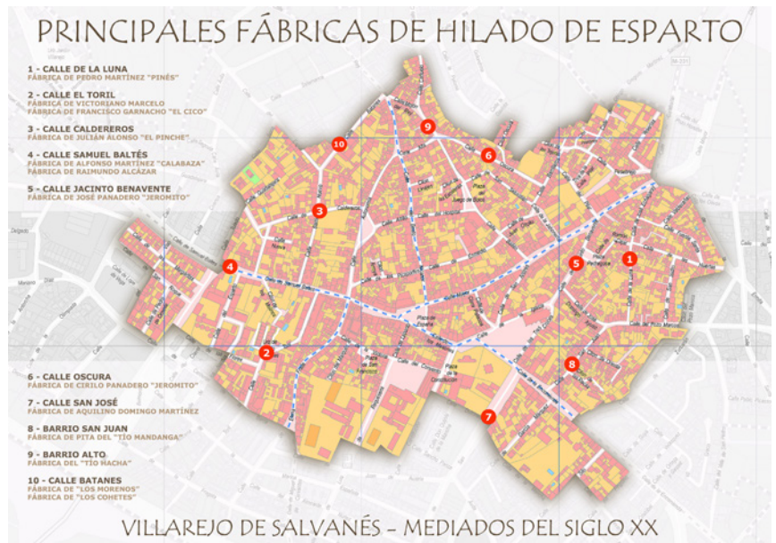
Fig. 4. Plano callejero de las principales fábricas de hilado de esparto que se asentaban a mediados del siglo XX en el casco urbano de Villarejo de Salvanes