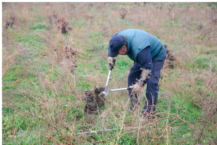
Fig. 4. Poda en viñedo viejo. San Martín de Valdeiglesias. 2021

ha rescatado viñedos antiguos que estaban prácticamente comidos por los arbustos y que hoy producen vinos de alta calidad. (Fig. 4).