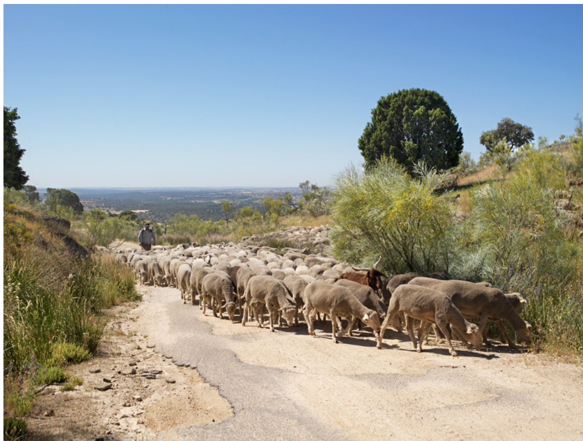
Fig. 4. Pastoreo. Colmenarejo.

de comunicación con relevancia del papel de facilitador, lo que propicia la transmisión intergeneracional, transcultural y diversa.