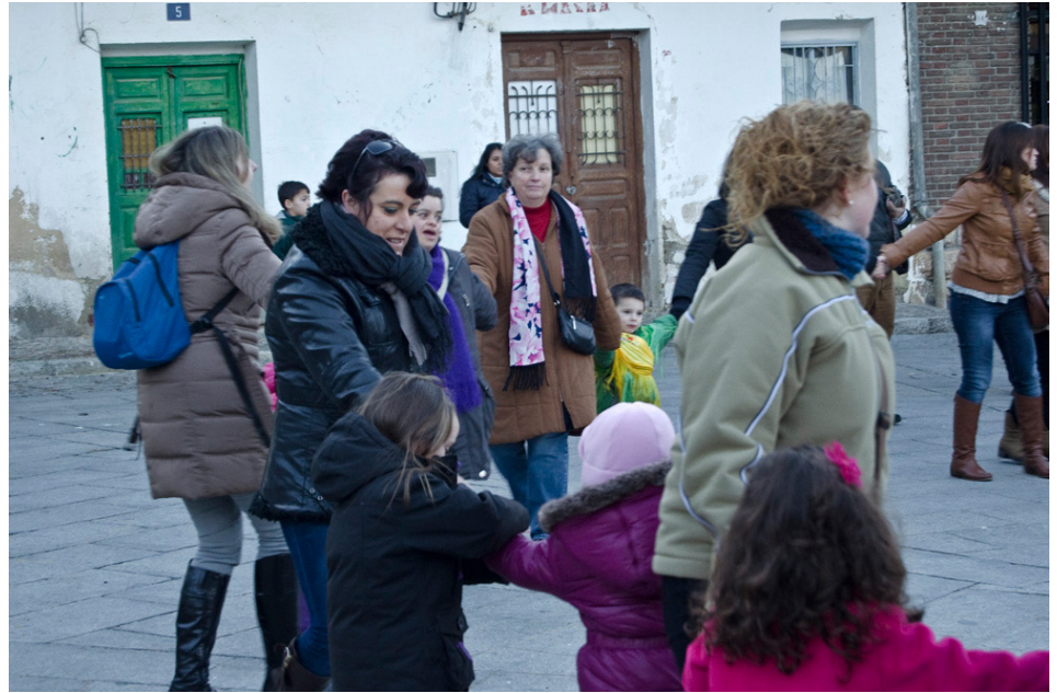
Fig. 1. Mujeres y niñas bailando en un corro en la plaza mayor. Fiesta de la Vaquilla de Pedrezuela. 2014

y compleja que «se conforma con todo aquello que, heredado de forma verbal, se transmite de padres a hijos, de vecino a vecino, de pueblo a pueblo hasta el momento presente» 7 . Si lo asociamos al concepto de ecología cultural, debemos tener en consideración que tradición también son los conocimientos asociados a las formas de expresión y de organización colectiva. De hecho, en las últimas décadas, el calificativo de «tradicional» ha dado un salto considerable hasta situarse en el plano de la ecología y la sostenibilidad, cuando encontramos muchas manifestaciones en cuyo apellido aparece de una forma muy reiterativa el concepto de tradicional: el queso tradicional, que es elaborado de forma tradicional; el vino tradicional, que sigue un proceso según la tradición del lugar; la danza y la música tradicionales y, en el caso textil, cuando las piezas están realizadas de forma tradicional en un telar tradicional o confeccionadas a la manera tradicional. La tradición presente en el proceso y en los instrumentos. Es la redundancia en el propio concepto.