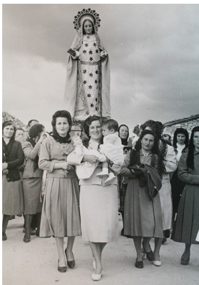
Fig. 8a. Matanza. Ciempozuelos. 1957