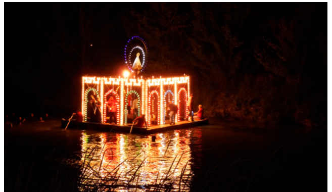
Fig. 6b. La procesión de los nadadores de la Virgen de Alarilla en Fuentidueña de Tajo.

colores. Recorre 800 metros por las aguas del Tajo, con los jóvenes custodiando, a nado, a la patrona; culmina la procesión con un castillo de fuegos artificiales.