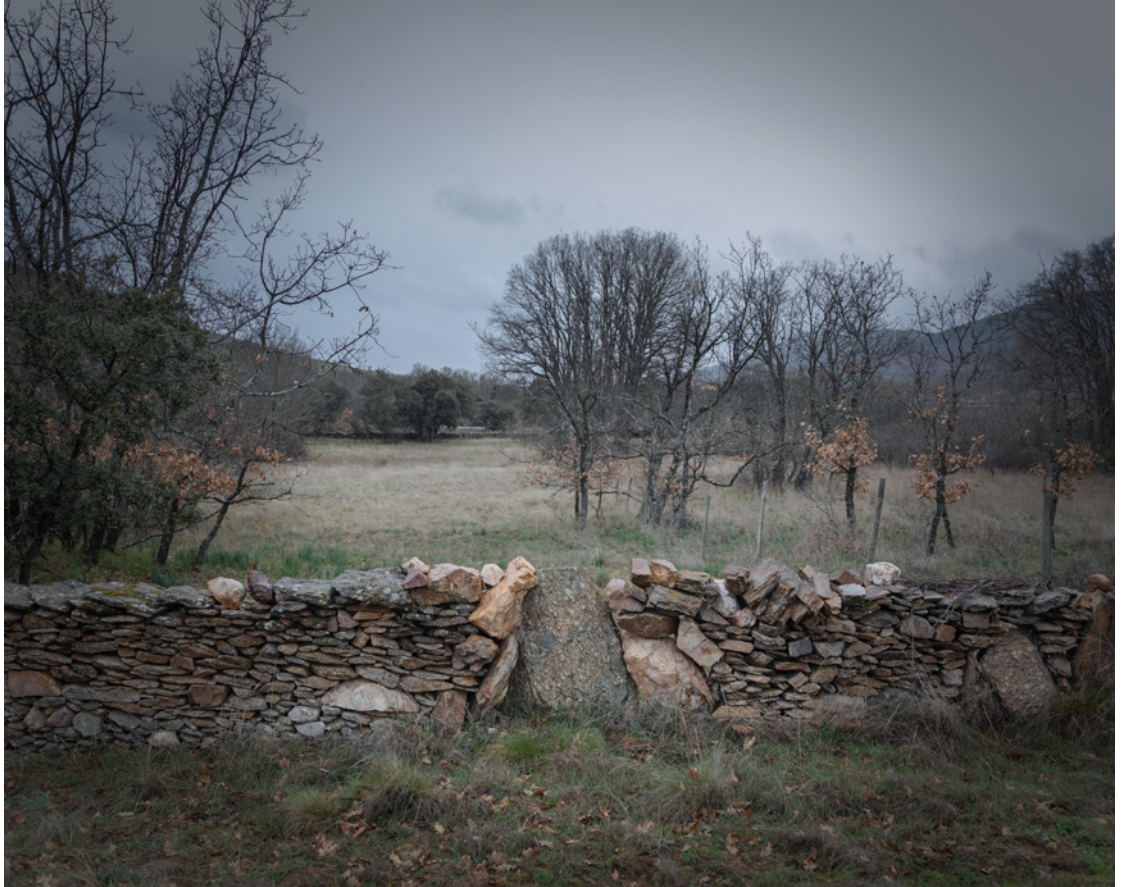
Fig. 3. Tapial de Piedra Seca. Berzosa del Loyola.

con una gestión multidisciplinar como casos de buenas prácticas.