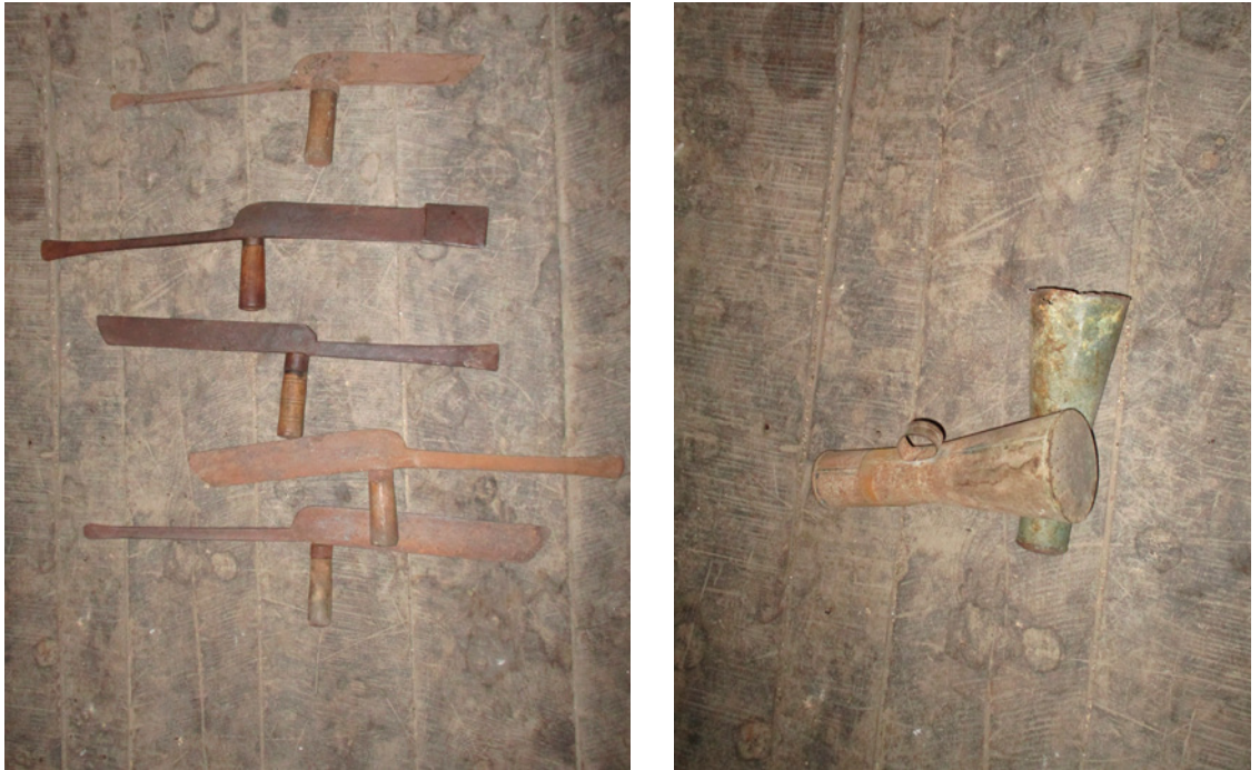
Figs. 5 y 6. Podones y azufradora. Cadalso de los Vidrios. Fotografías de Luis Vicente Elías. 2021

Es interesante también destacar que lo que hoy se define como viticultura ecológica es simplemente la forma de cultivo que nos han descrito nuestros informantes, en la que no se emplean productos químicos en los tratamientos —a excepción del azufre—, se realizan la mayor parte de las tareas a mano y el laboreo se practica mediante caballerías. Se tienen en cuenta los ciclos lunares para las labores de poda y para el trasiego de los vinos y se transforman todos los productos obtenidos de la cepa, ya que los restos de poda constituyen combustible, con la uva se elaboran postres y con el mosto se preparan arropes que endulzan las mesas navideñas al lado del aguardiente casero. Además, es un sistema en el que el ciclo anual se regula por medio de dichos y refranes, dando así continuidad a una tradición milenaria.