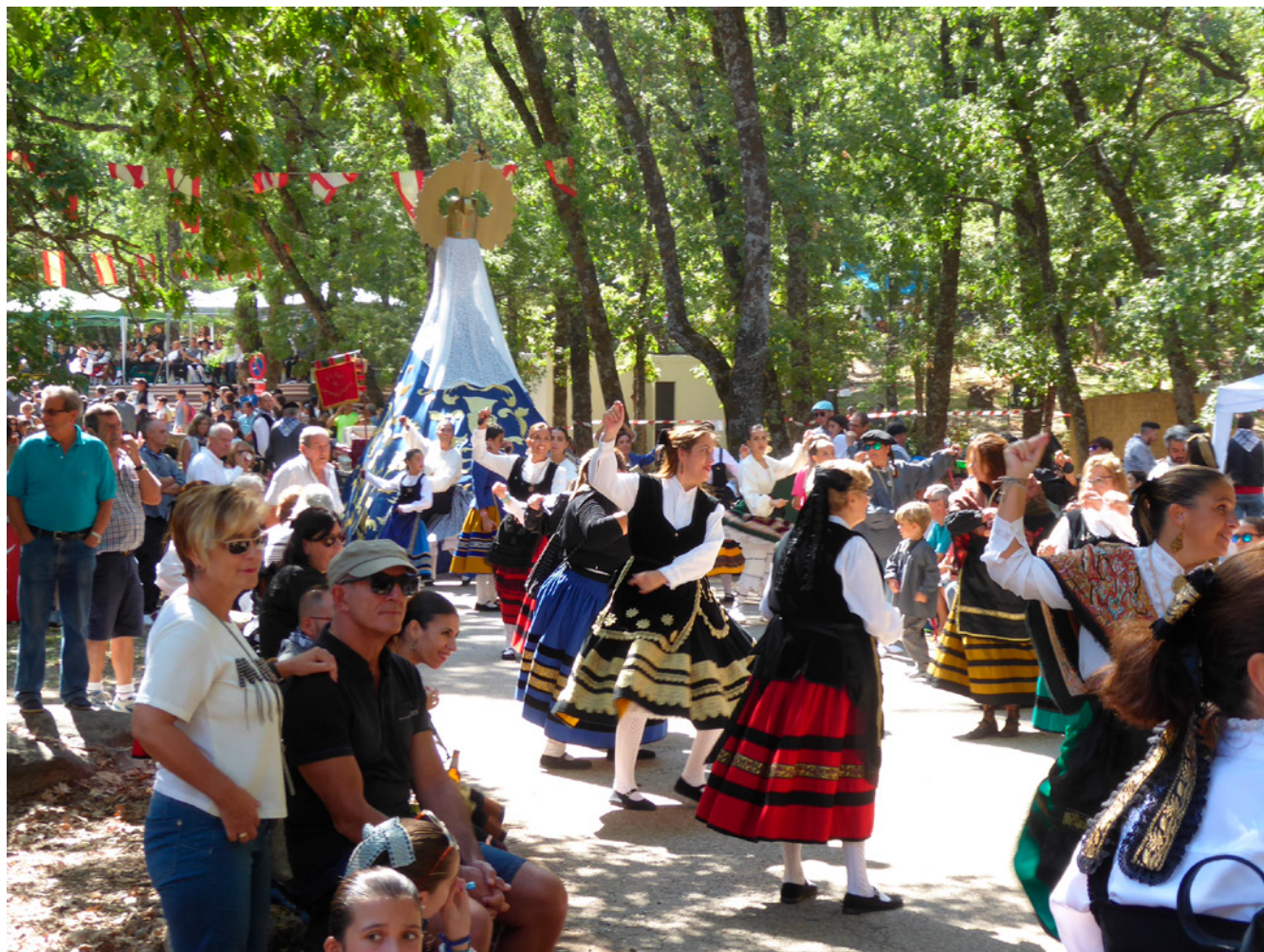
Fig. 5. Fiestas y festivales son momentos de encuentro entre comunidades portadoras y turistas y, en muchas ocasiones, una excelente oportunidad para revitalizar algunas tradiciones. San Lorenzo de El Escorial. 2019

las realidades sociales, es extremadamente cambiante en el tiempo, buscando nuevas soluciones que den respuesta a las nuevas demandas que van surgiendo. Y, por último, porque las tensiones que genera su interrelación obligan a ir buscando soluciones a los problemas que vayan surgiendo e incorporarlas a nuestro marco de acción. Este proceso nos obliga a mantener una permanente atención sobre el desarrollo del proceso y a abordar los necesarios ajustes que estos cambios puedan ir produciendo. Del mismo modo, esto nos exige mantener abiertos los procesos de participación a lo largo del tiempo.