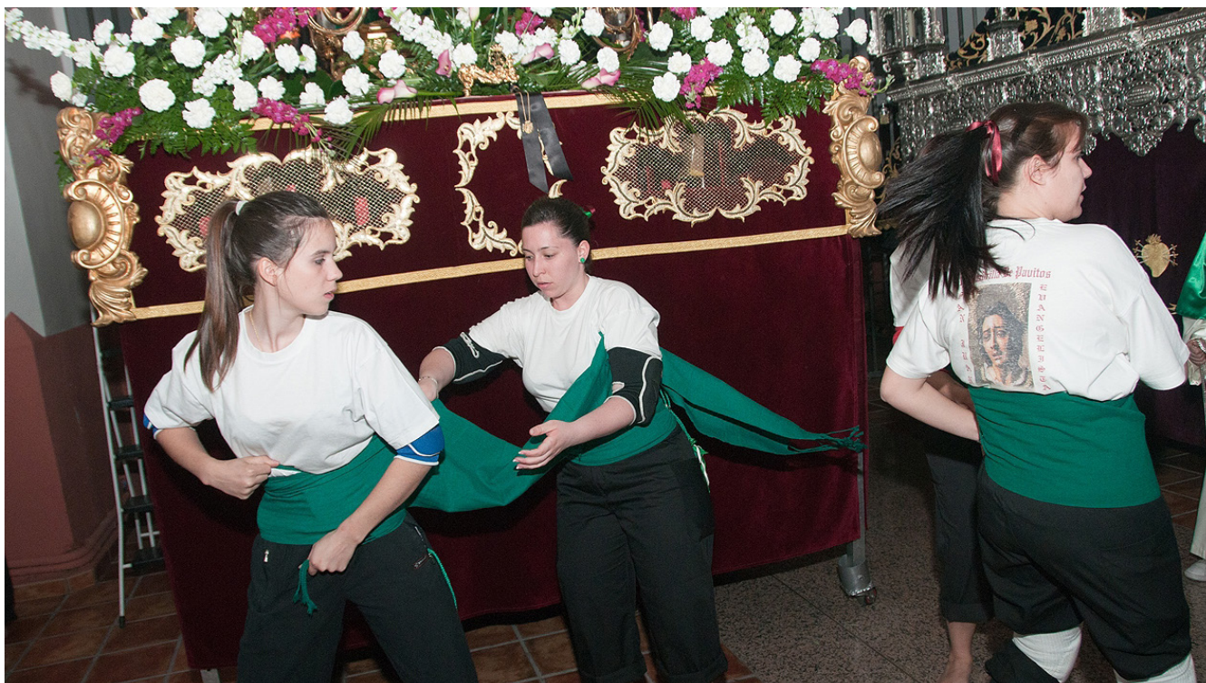
Fig. 3. Fiesta del Niño en Navalagamella. 2015

fomento de los negocios locales. Es el caso de pueblos como Buitrago de Lozoya, El Molar, El Berrueco, Chinchón, San Lorenzo de El Escorial o Navalcarnero, que, gracias a sus representaciones y teatralizaciones populares, visibilizan sus formas de expresión.