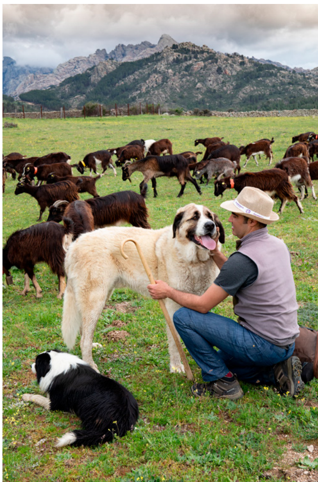
Fig. 2. Mastín español empleado para proteger el rebaño municipal de ataques de lobos y de otros perros durante los pastoreos junto a la Pedriza.