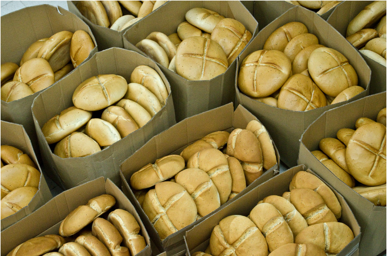
Fig. 13. Panes de anís preparados para el reparto comunal. Fiesta de San Sebastián. Pedrezuela. 2014

hasta el parque del río para degustar una merienda a base de tortilla de patatas y arroz con leche que sufraga el ayuntamiento. El hornazo se consume en Valdemanco, Fuentidueña del Tajo, Montejo de la Sierra, Canencia o en Morata de Tajuña, donde es el postre protagonista del Domingo de Resurrección, cuando las cuadrillas, grupos o peñas acuden a la Vega del Tajuña para hacer una comida de hermandad conocida como «correr el hornazo», nombre dado por la tradición de que los niños jueguen a romper con sus cabezas los huevos duros de la parte superior de esta preparación. Otro ejemplo de gastronomía ritual vinculada a momentos del ciclo anual litúrgico son las «puches» del Día de Todos los Santos, consumidas en el campo en Zarzalejo o en grupos de amigos en Pedrezuela.