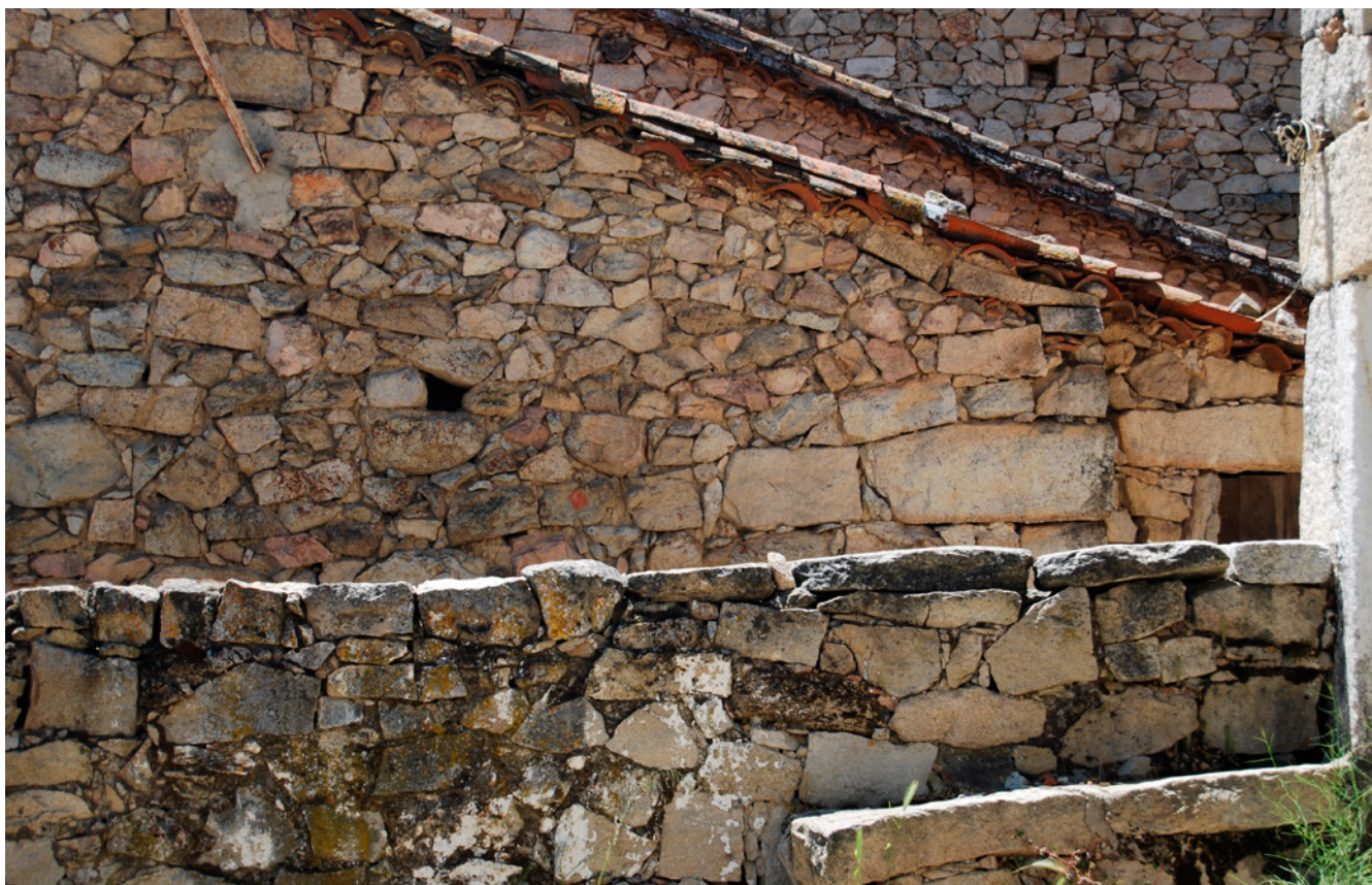
Fig. 5. Viviendas tradicionales en El Berrueco. 2015

por los municipios de la sierra en la recuperación de sus potros de herrar como elemento representativo de la actividad ganadera—; edificios destinados al esquila; batanes, tejares, carboneras y colmenares; estructuras de almacenaje para los frutos del bosque o leña, y pequeños ingenios para la caza, entre otros.