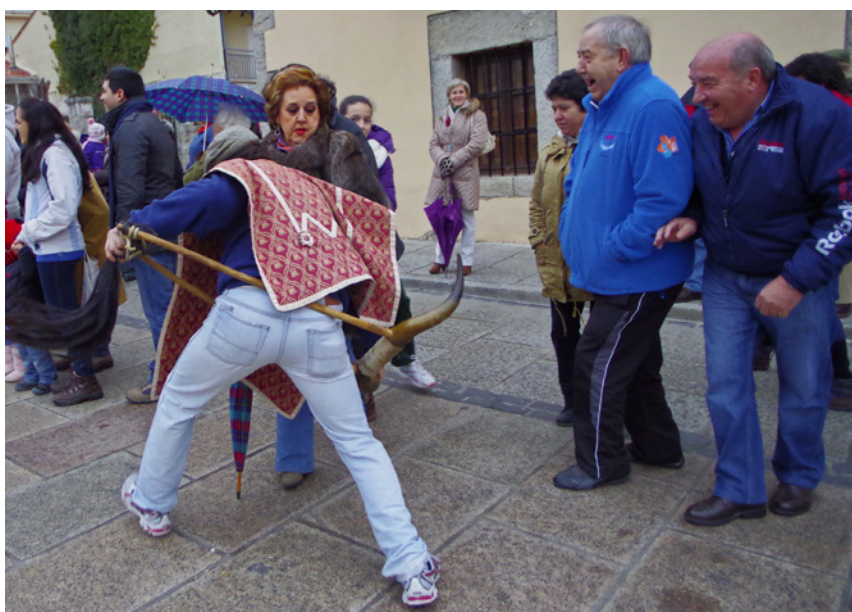
Fig. 4. Vaquilla de Los Molinos.

no económicos encaminados hacia el fomento de la creatividad, el ocio, el juego, la celebración, la experimentación artística o la estimulación intelectual para todos, y no solo para aquellos que pertenecen a determinada clase social 42 . En palabras de Giorgos Kallis, «todos deberían ser aristócratas durante una parte de su tiempo; todos deberían tener una participación en lo que Hannah Arendt llamó la vida “activa”» 43 . Entre las manifestaciones de patrimonio inmaterial podemos encontrar numerosos ejemplos donde se practica tradicionalmente la dépense : cualquier banquete comunitario, fiesta profana como un carnaval, celebración religiosa o juego que suponga este tipo de gasto «improductivo» lo es. Por ejemplo, en Villa del