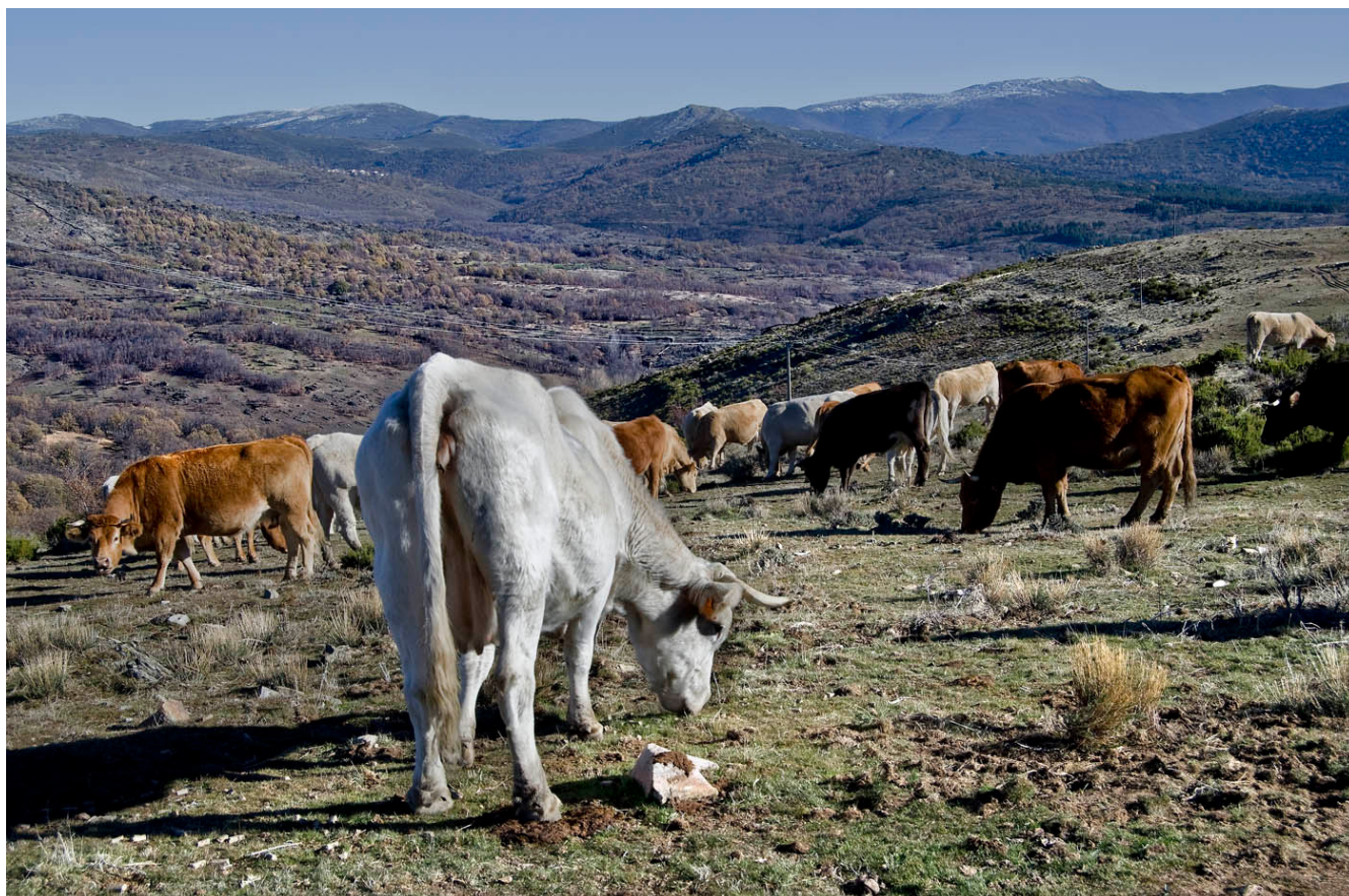
Fig. 5. Actividad ganadera. Sierra Norte. Fotografía Jesús Herrero. 2013

consumo. Podemos distinguir varias vertientes dentro de la sostenibilidad económica del PCI: por un lado, la viabilidad económica de las propias manifestaciones culturales a largo plazo; por otro, la contribución de este patrimonio al desarrollo económico del entorno; y al mismo tiempo, también podemos incluir la gestión eficiente de los recursos económicos por parte de los agentes implicados.