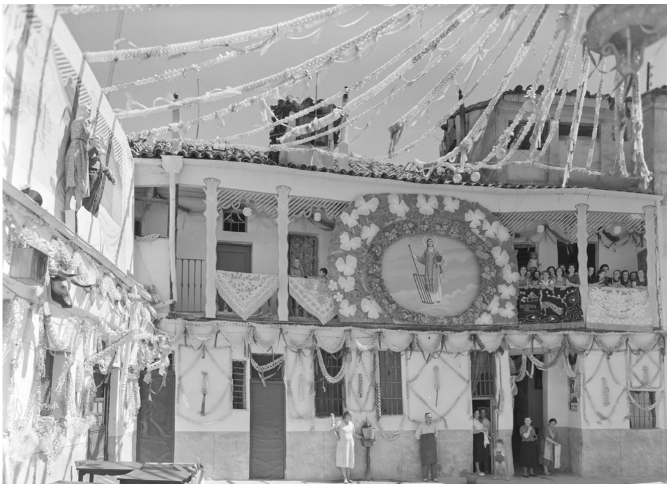
Fig. 2. Patios de una corrala de Lavapiés engalanados con motivo de la festividad de San Lorenzo y San Cayetano 1954. Archivo Pando, IPCE, Ministerio de Cultura y Deporte. Signatura: PAN-063655

y de la importancia que tiene la celebración para la comunidad.