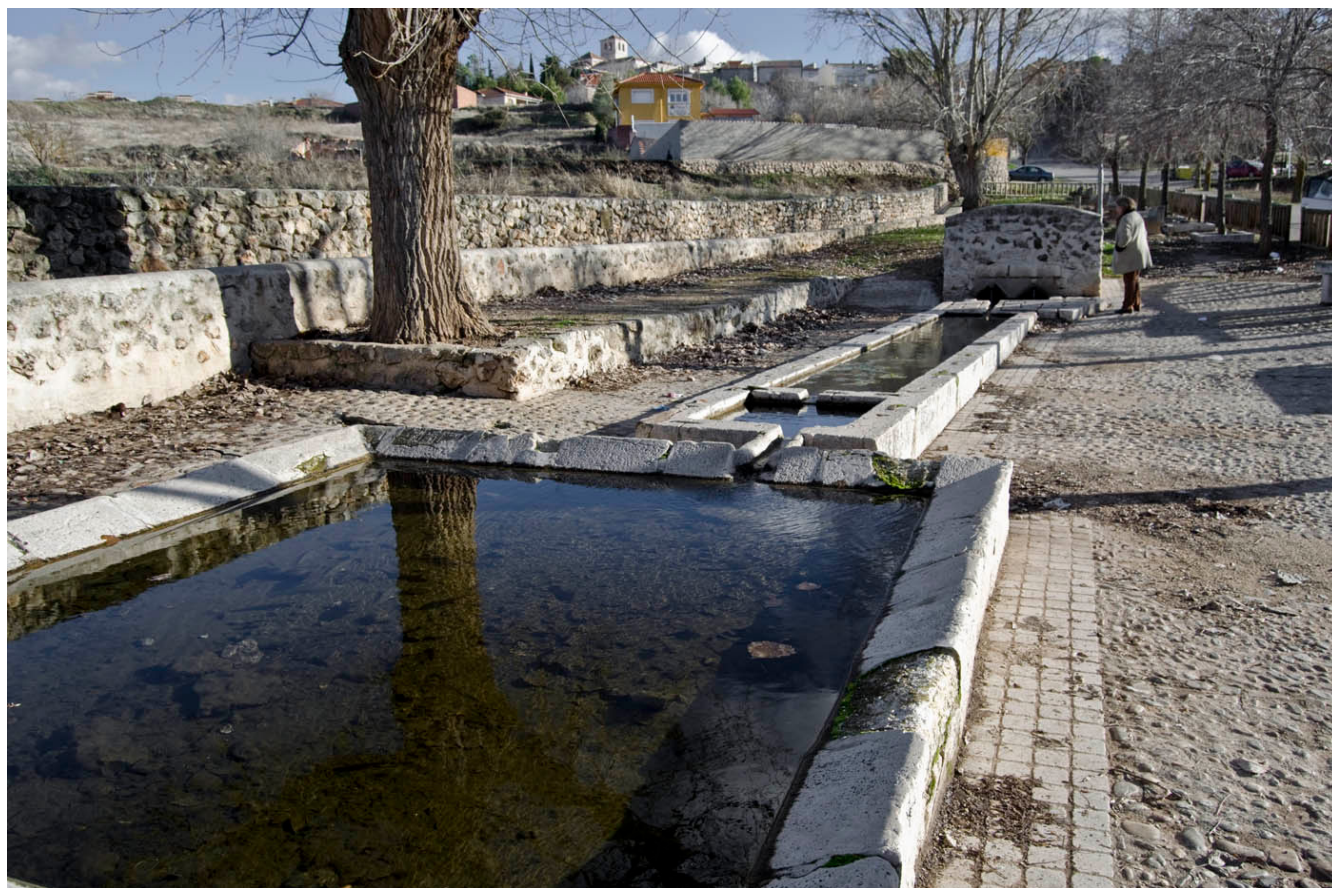
Fig. 16. Fuente, abrevadero y lavadero municipal. Belmonte de Tajo. 2013

de los procesos por sus protagonistas. Es este un interesante proyecto al que se dedica un artículo en esta obra, por lo que tendrán la oportunidad de conocerlo de manera más amplia.