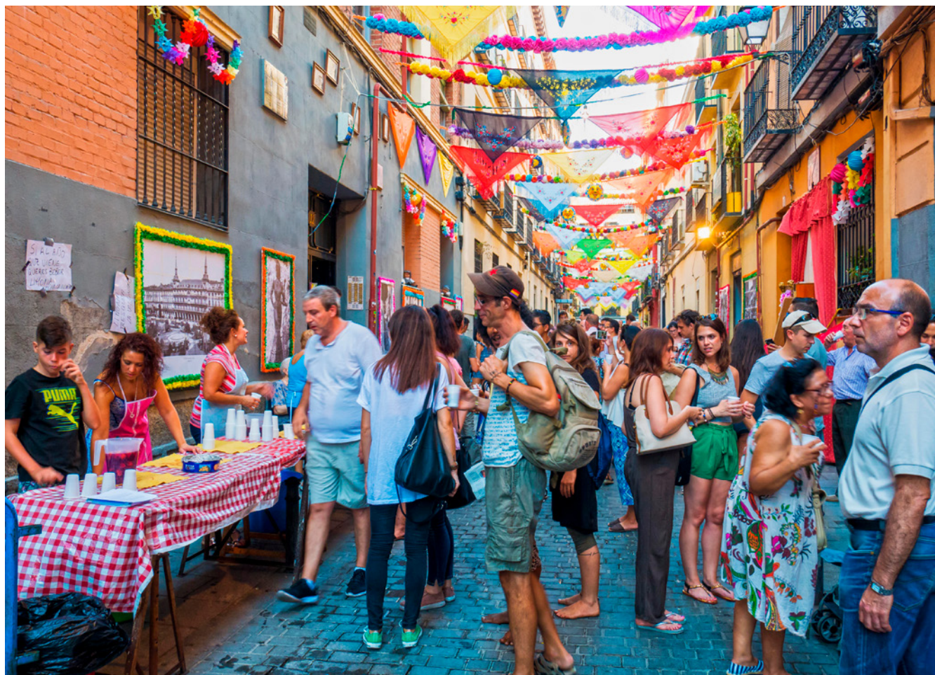
Fig. 1. Vecinos ofreciendo limonada gratuita a los asistentes a la verbena de San Cayetano.

la consecución de los Objetivos de Desarrollo Sostenible (ODS) 10 que componen dicha agenda.