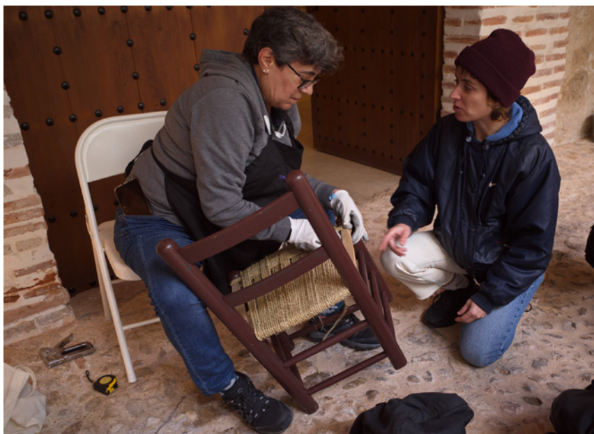
Fig. 2. Silla. Villarejo de Salvanés.

proximidades. En Madrid, al igual que en otros lugares, los productos de proximidad parecen disfrutar cada vez de una mayor deseabilidad: según un estudio 34 , el 85 % de los madrileños adquiere alimentos de proximidad habitualmente. Existen decenas de productores de cercanía en la Comunidad de Madrid que abastecen sin intermediarios y estableciendo relaciones personales con los consumidores emergentes de estos productos, así como asociaciones creadas específicamente para gestionar huertos de autoconsumo comunitarios, como sucede en el pueblo de Pedrezuela. Mas allá de los alimentos, en la Comunidad de Madrid tenemos muchos ejemplos de producción localizada, inspirados directamente en formas consuetudinarias que regían