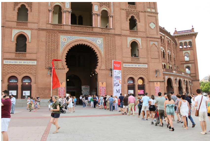
Fig. 3. Entrada #Cómete Las Ventas. Comunidad de Madrid